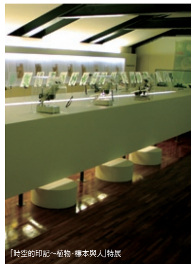
「時空的印記—植物·標本與人」特展