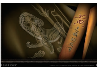
◎ 第七屆網路金手指獎教育學習類金手指獎