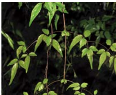
梨山小囊衣藤的葉子