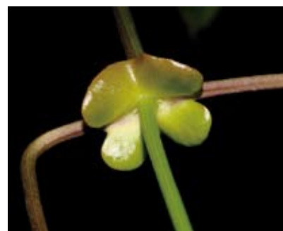
田代氏鐵線蓮的葉柄基部

4. 田代氏鐵線蓮 ：也叫琉球鐵線蓮，廣布於全臺低至中海拔山區，為大型的木質藤本，攀緣能力甚強。成株的葉子結構為一回羽狀複葉或三出葉，小