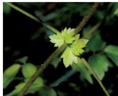
梨山小囊衣藤的托葉