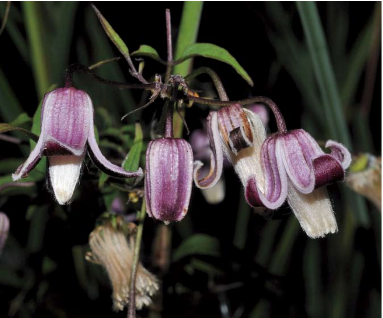
小木通的花有與眾不同的顏色