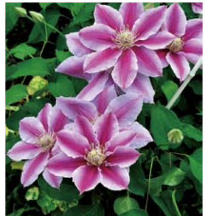
園藝種鐵線蓮之二

例外，許多大花型的觀賞種類甚至也有結果能力，用播種法大量育苗必定可行。臺灣原生的屏東鐵線蓮、田代氏鐵線蓮、小木通與繡球藤等，都具有不凡的姿色，應可用來做雜交育種，讓寶島的園藝種鐵線蓮也能出類拔萃，個人殷切地期盼著，你呢？