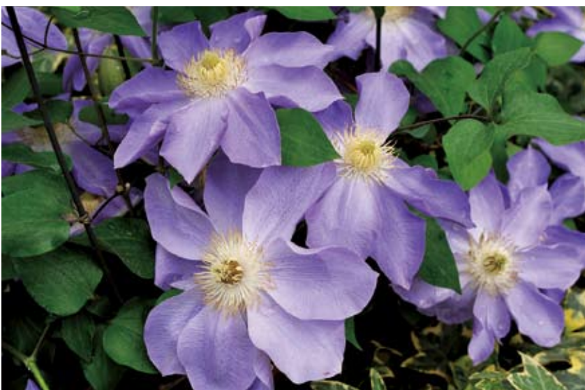
園藝種鐵線蓮之三