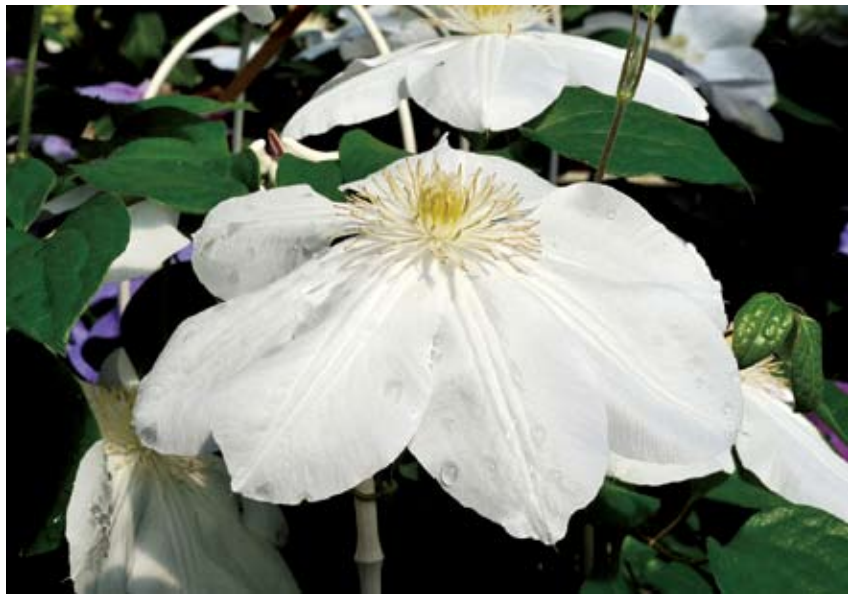
園藝種鐵線蓮之一

例外，許多大花型的觀賞種類甚至也有結果能力，用播種法大量育苗必定可行。臺灣原生的屏東鐵線蓮、田代氏鐵線蓮、小木通與繡球藤等，都具有不凡的姿色，應可用來做雜交育種，讓寶島的園藝種鐵線蓮也能出類拔萃，個人殷切地期盼著，你呢？