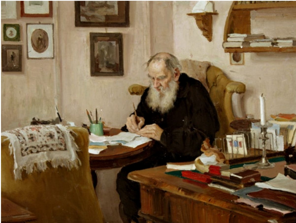
托爾斯泰在稿寫作的油畫