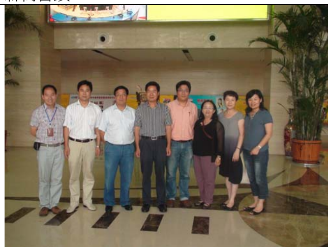
踩地考察團團員參觀鄭州人民廣播電台