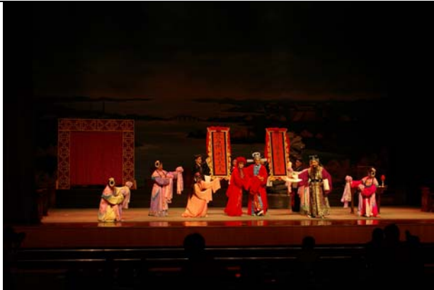
平頂山民眾十分喜愛《秦少游與蘇小妹》