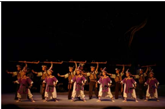
河南省豫劇二團演出《臺北知府》