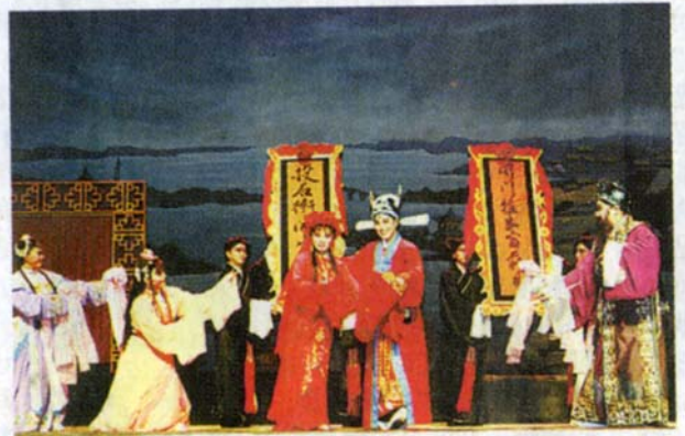
台湾豫剧团在豫演出

据悉,为使更多市民走进剧场观看演出,本次展演特别打出了“公益票价”,分为10元、20元、30元、50元四个档次。