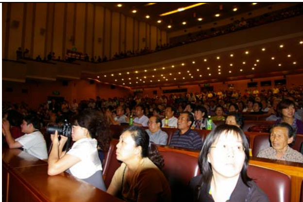
《曹公外傳》演出觀眾滿座