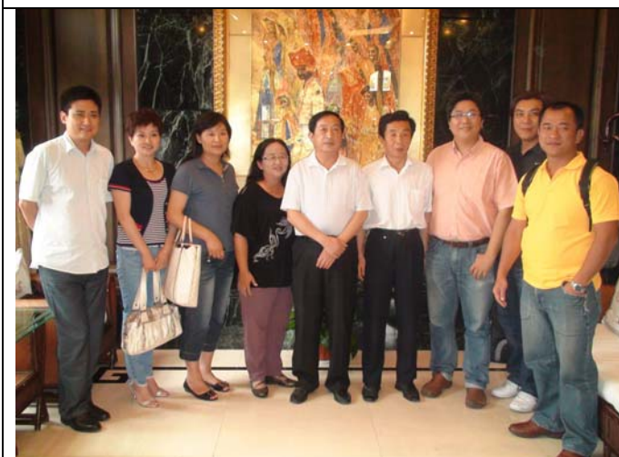
商丘市豫劇院為安排來台演出特來鄭州商議