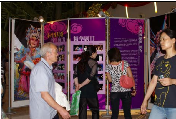
河南民眾對於臺灣豫劇團演出前展覽特別感興趣