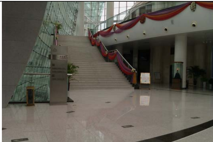
鄭州藝術中心前台景觀