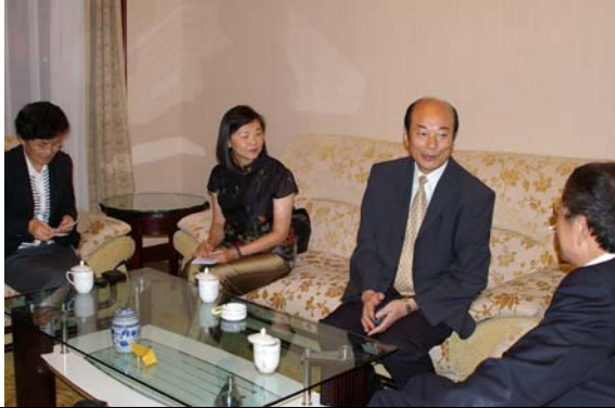
歡迎晚宴前的會談