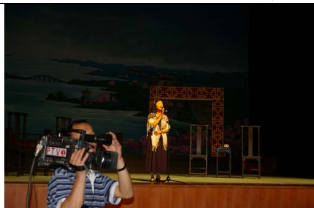
蘇團長於《秦少游與蘇小妹》演出前致詞