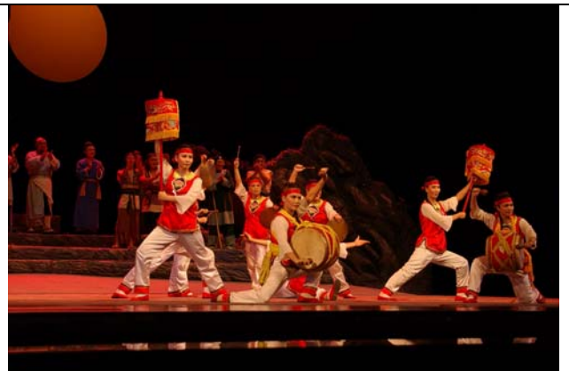
《曹公外傳》情節---歡樂跳鼓陣展現台灣特有的民間藝術