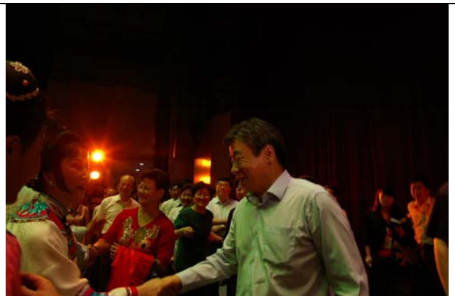
省委書記盧展工先生向《曹公外傳》演員致意