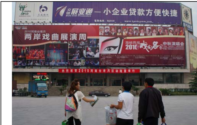
人民大會堂門口懸掛大型宣傳看板