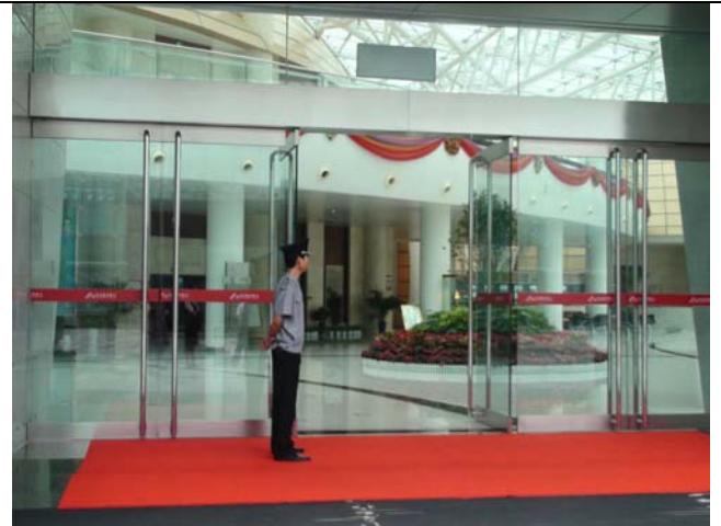
鄭州藝術中心氣派的前廳