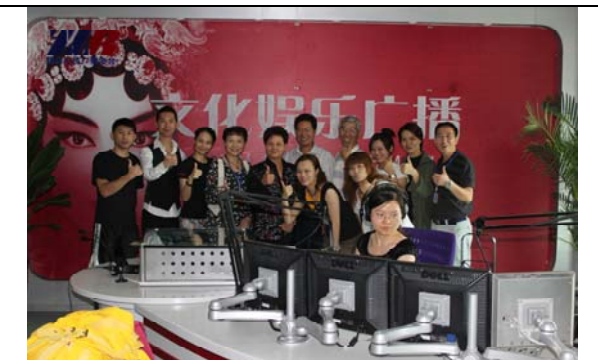
臺灣豫劇團七位參加「叱吒中原」排行榜演員與節目主持人合影