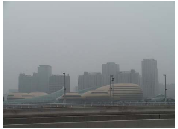
鄭州藝術中心宏偉的外觀