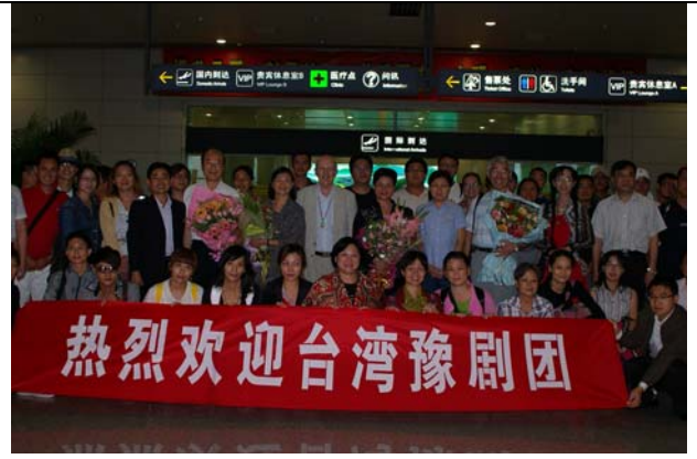
新鄭機場熱情的歡迎行列