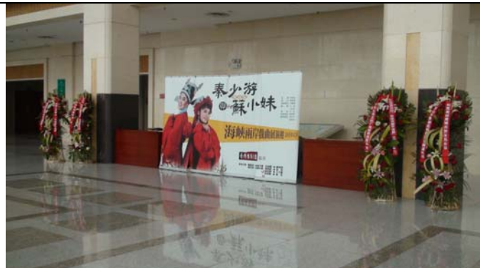
平頂山演出新編豫劇《秦少游與蘇小妹》