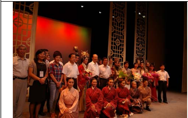
《約束》演出結束後演員與嘉賓們合影