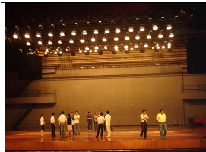
平頂山市新城區會議中心場勘