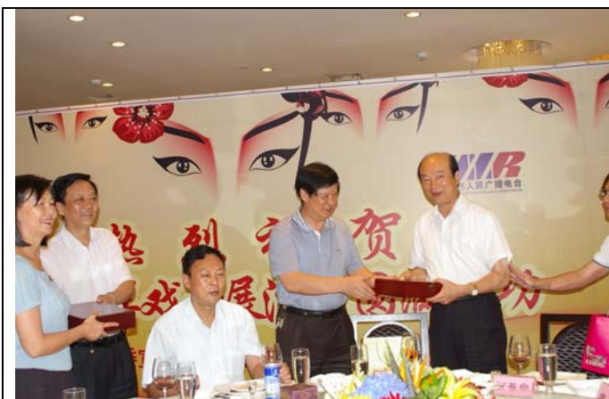
柯基良主任與鄭州市宣傳部副部長龔守鵬交換紀念品