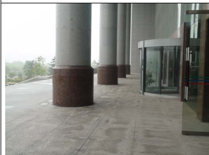
平頂山市新城區會議中心外觀