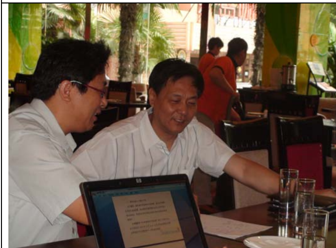
考察完畢返台前的備忘會議