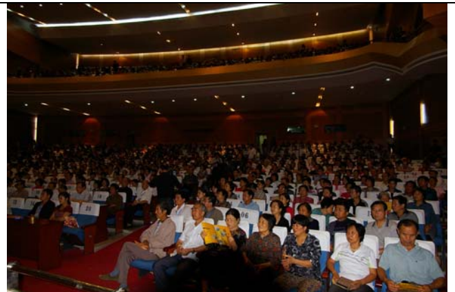
平頂山觀眾熱愛戲曲