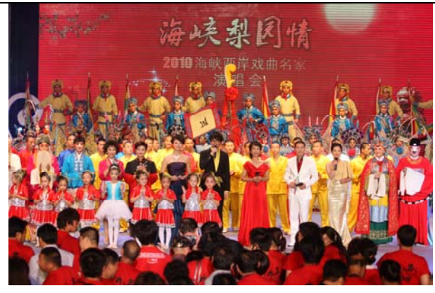
海峽梨園情演唱會謝幕大合唱