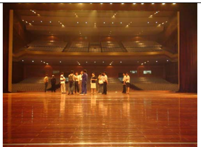
平頂山市新城區會議中心舞台及觀眾席