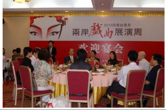
河南省各界熱烈歡迎台灣豫劇團