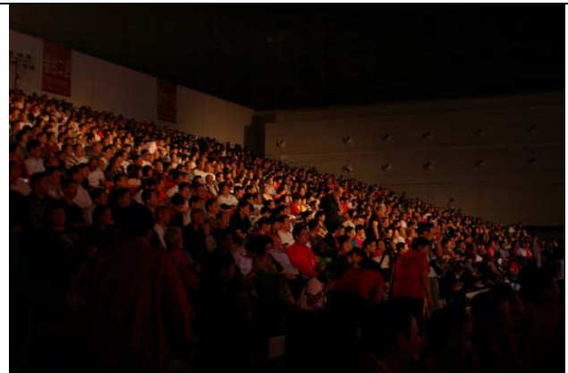
鄭州民眾熱情參與海峽梨園情中秋演唱會