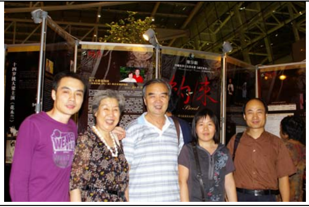
知名音樂家耿玉卿老師率同家人參觀臺灣豫劇團展覽