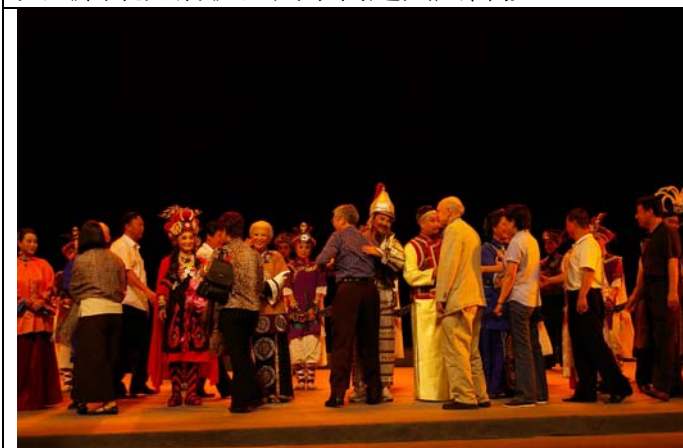
《台北知府》謝幕後嘉賓上台致意