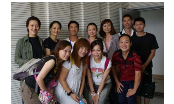
臺灣豫劇團演員與鄭州電台叱吒中原節目主持人合影