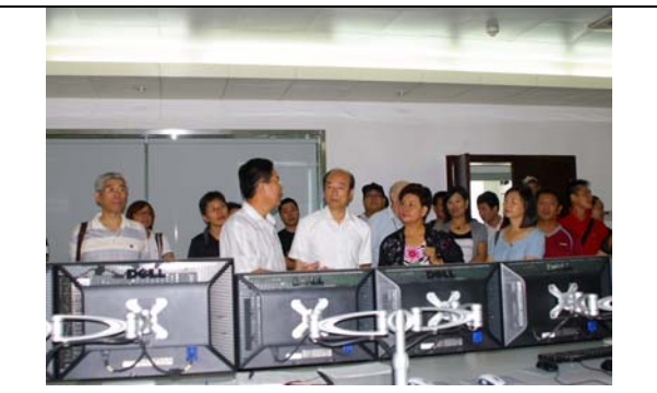
鄭州電台台長向台灣豫劇團團員介紹該台營運情況