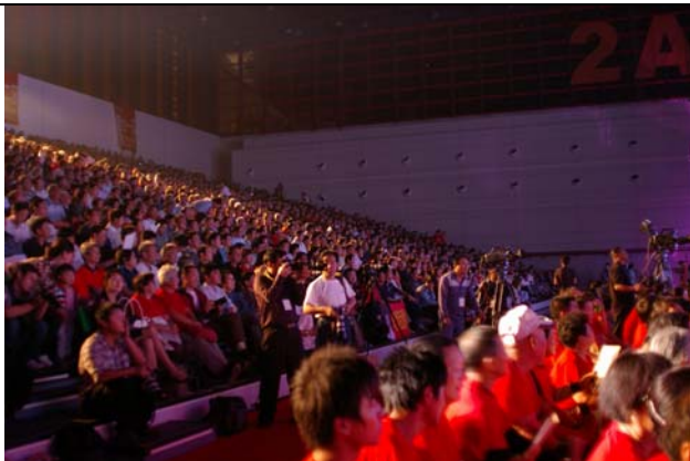
海峽梨園情中秋演唱會吸引數千名觀眾參與