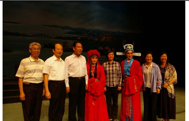
《秦少游與蘇小妹》主要演員與河南省文化廳長楊麗萍合影