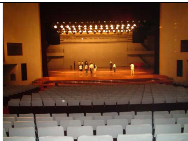
平頂山市新城區會議中心觀眾席