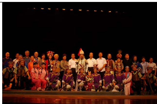
嘉賓與《台北知府》演員們合影