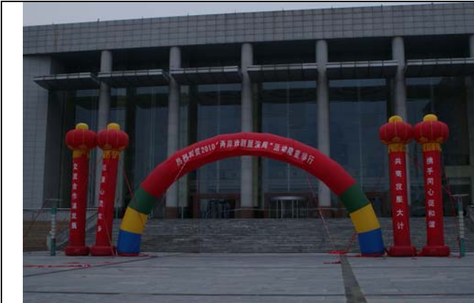
平頂山市各界搭建牌樓歡迎台灣豫劇團