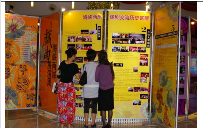
兩岸豫劇交流是觀眾們最感興趣的展覽單元