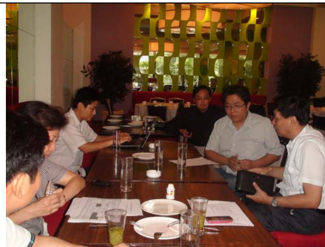
為了便於兩岸交流演出宣傳特別將企劃活動名稱定為「海峽兩岸戲曲展演週」