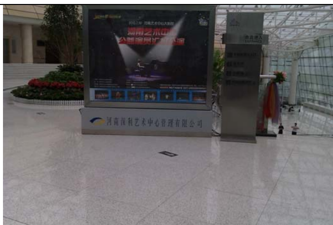
鄭州藝術中心委託保利集團經營管理