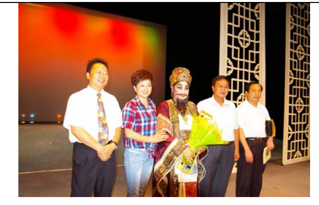
商丘市豫劇院陳新琴院長與台灣豫劇皇后王海玲合影