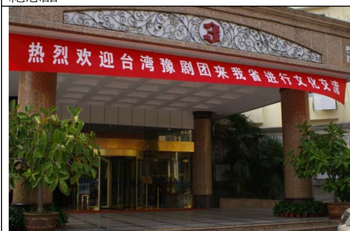
鄭州紫荊山飯店懸掛歡迎臺灣豫劇團布條