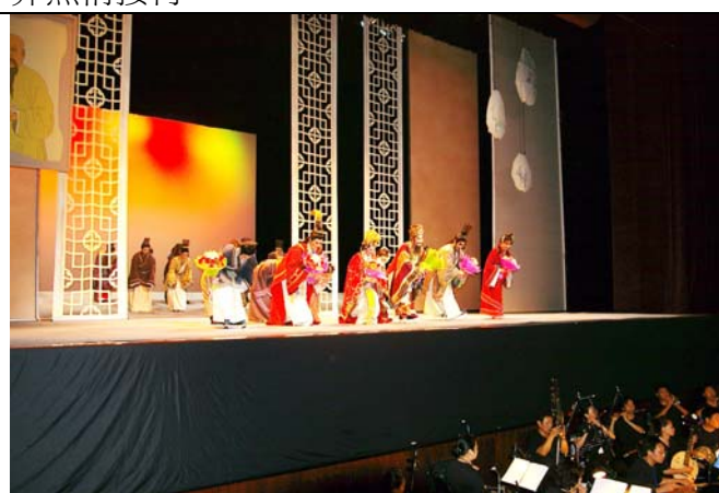
9月12日演出豫莎劇《約束》後謝幕