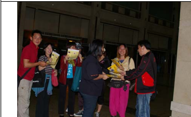
臺灣豫劇團團員觀賞台北知府