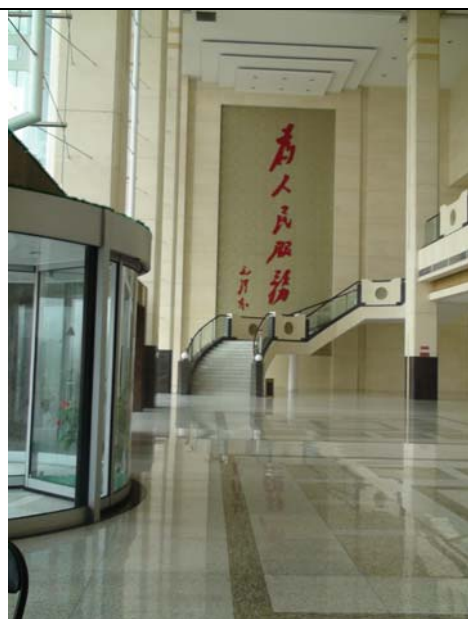
平頂山市新城區會議中心前台