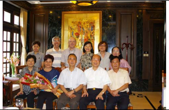
河南省前副省長賈連朝前來歡迎台灣老朋友