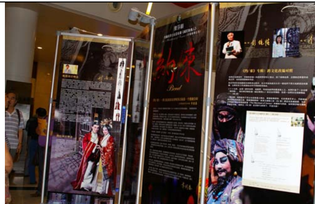
臺灣豫劇團《約束》演出前台舉行精彩的展覽