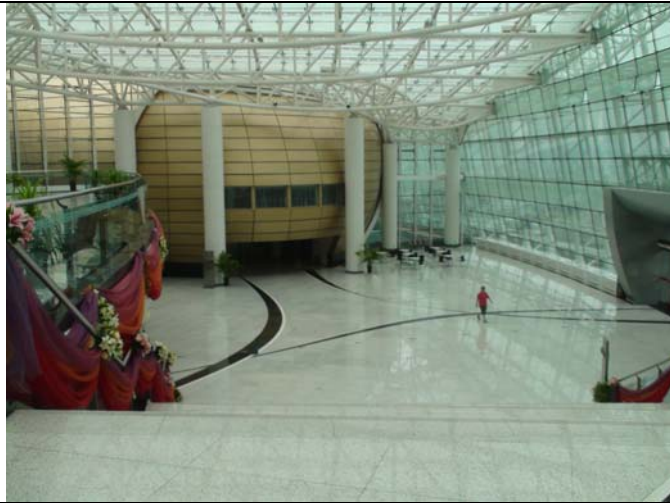
鄭州藝術中心寬敞前台