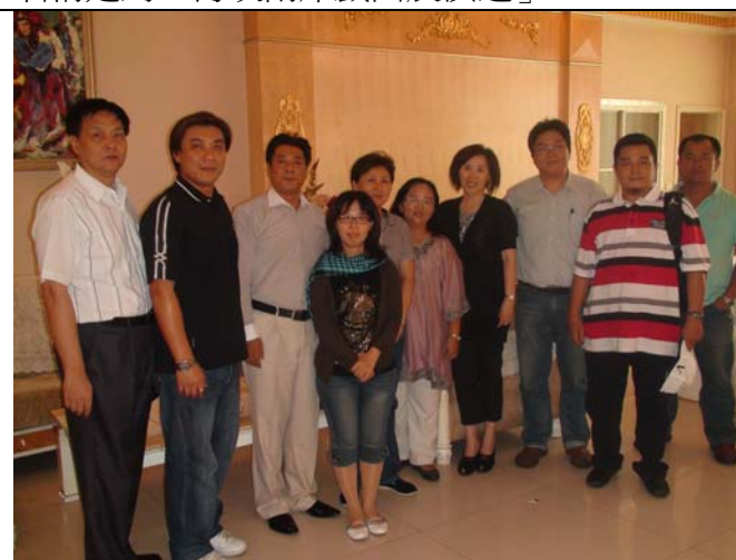
考察完畢準備返台前的合影