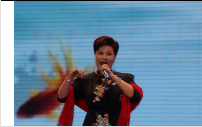
台灣豫劇皇后王海玲參加中秋戲曲演唱會