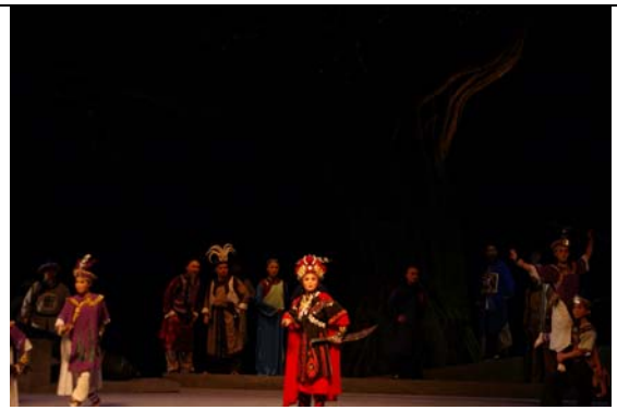
河南省豫劇二團演出《臺北知府》