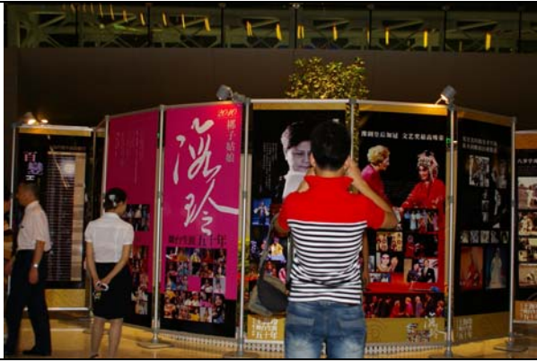
河南觀眾仔細研究臺灣豫劇團歷史