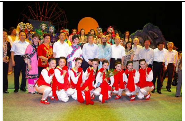
兩岸聯演《曹公外傳》廣受歡迎