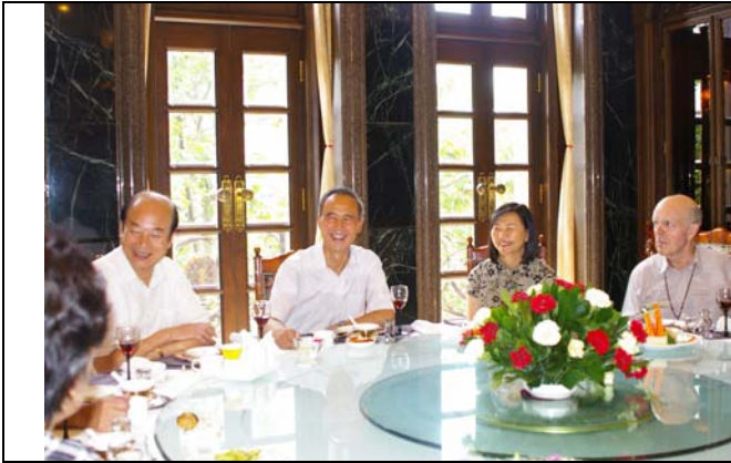
柯主任與蘇團長和河南省藝文人士交流