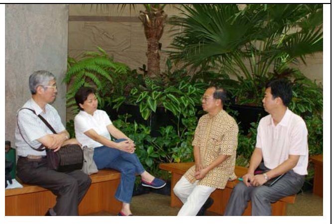
兩岸連袂拜訪新台幣濱海藝術中心