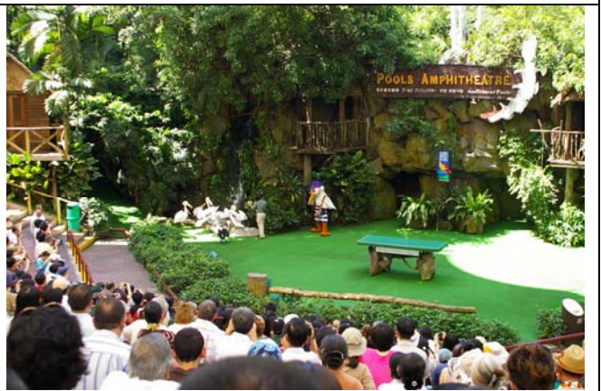
新加坡飛禽公園的活動規畫十分有趣