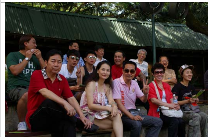
兩岸豫劇藝術家一同參訪