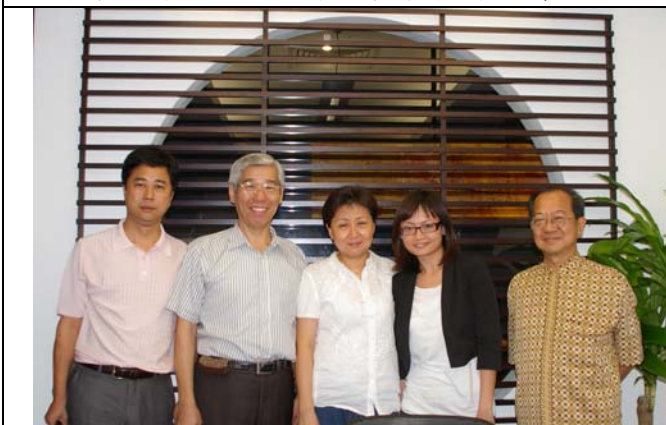
兩岸藝術家拜會新加坡濱海藝術中心