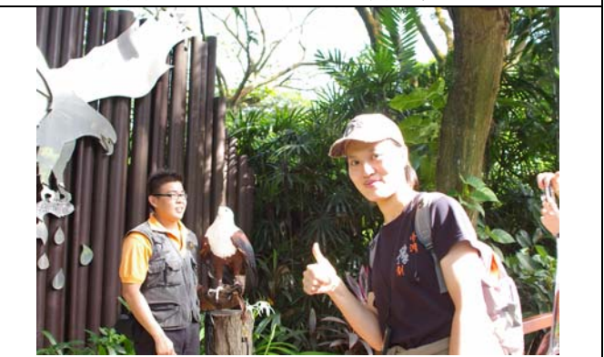
遊客到了裕廊飛禽公園自然輕鬆愉快