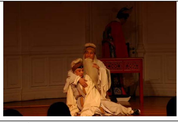
《清風亭上》賺人熱淚