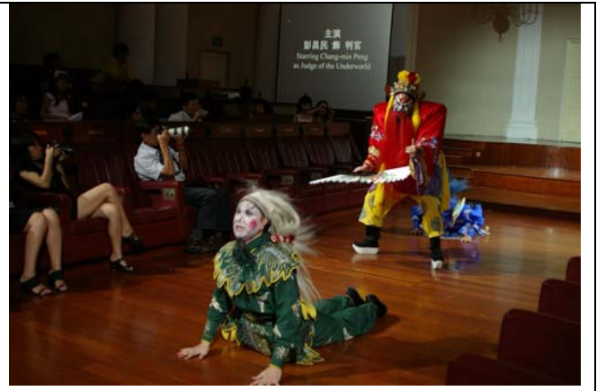
臺灣豫劇團演出觀眾特別喜愛