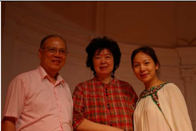
國光劇團團長藝術總監與戲曲學院副院長合影