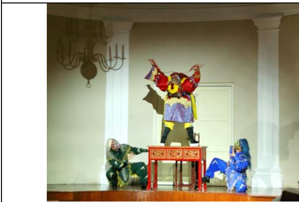
《司文郎》演出精彩畫面