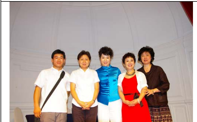
國光劇團藝術總監王安祈與大陸藝術家合影