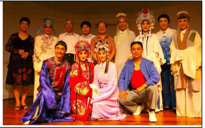
演出後兩岸及新加坡藝術家合影