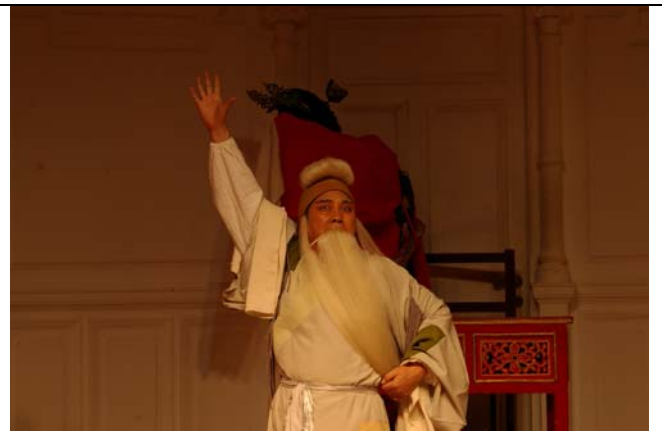
大陸一級演員李樹建拿手戲《清風亭上》