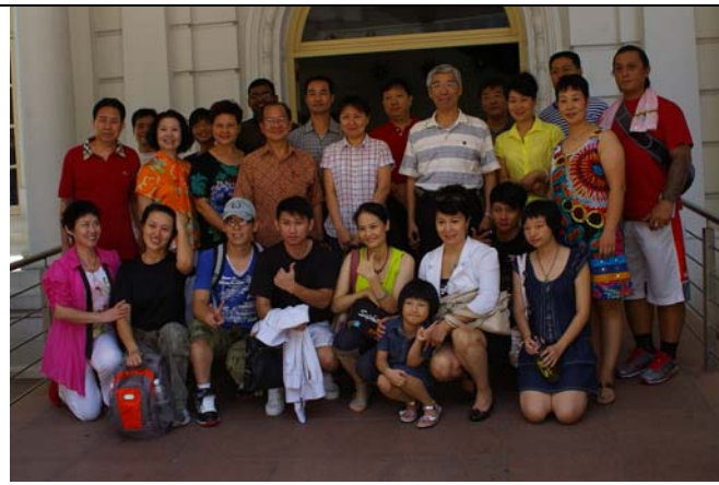
兩岸及新加坡藝術家大合照