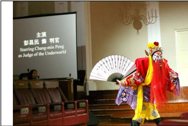
臺灣豫劇團發揮團隊精神博得很多掌聲