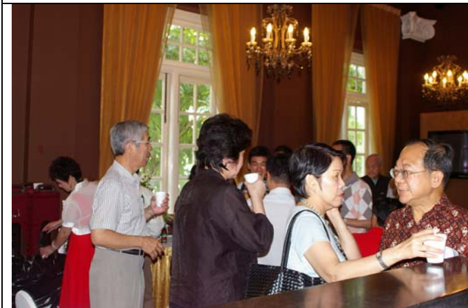
研討會中茶敘時間大家盡情敘舊