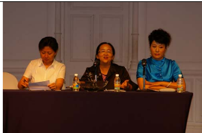
研討會充滿了歡笑與熱情令人難忘