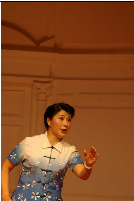
汪荃珍演出《香魂女》