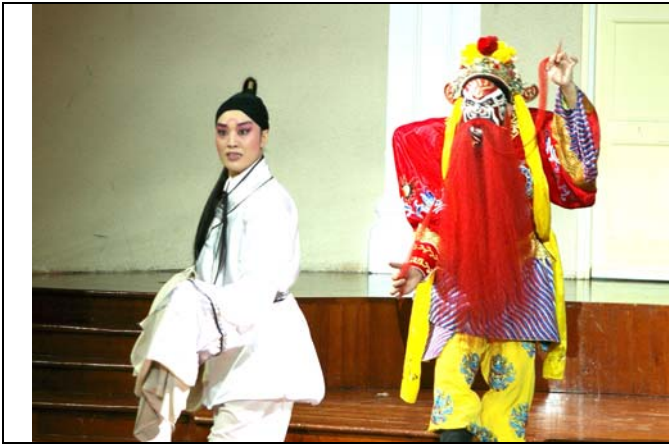
劉建華演出《司文郎》頗受好評