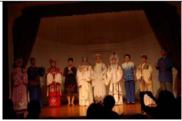
兩岸豫劇藝術家合唱《花木蘭》