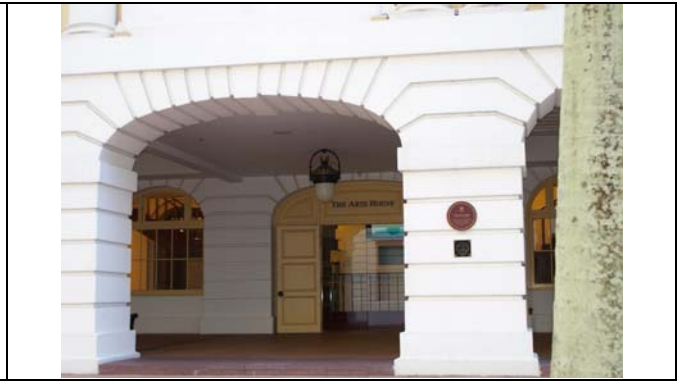
新加坡舊國會大廈成了藝術之家