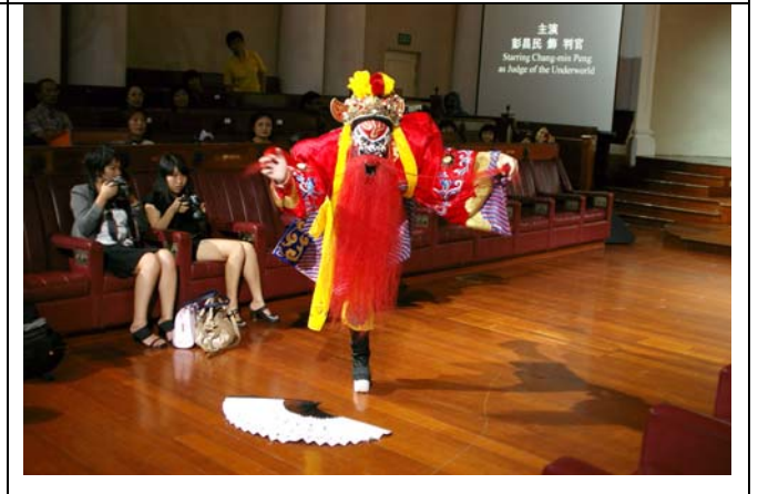
演員穿厚底展現此絕活另觀眾大開眼界