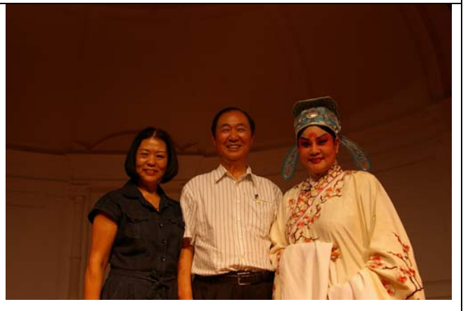
新加坡觀眾爭相與台灣豫劇皇后合影