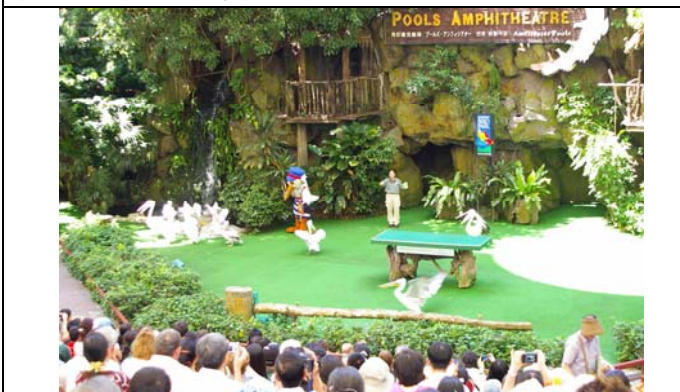
裕廊飛禽公園很有觀光價值