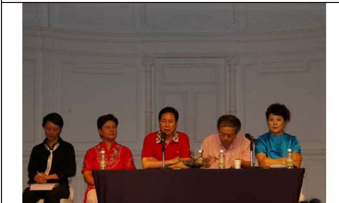
研討會場面熱絡溫馨