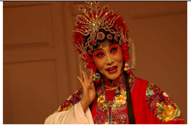
梅花獎得主史茹表演《抬花轎》