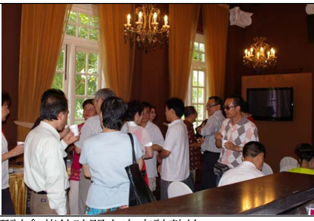
研討會茶敘時間大家交談熱絡