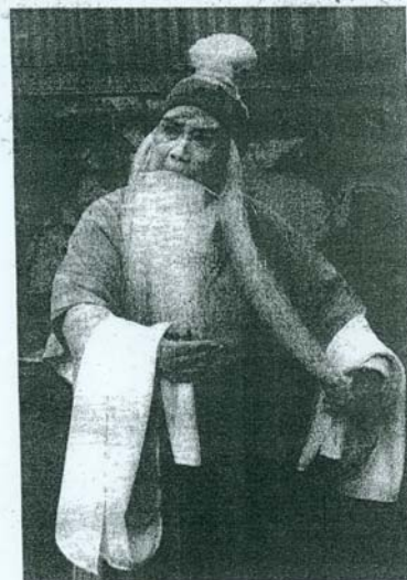
河南省豫剧二团团长、国家一级演员李树建将演出《清风亭上》（华族文化节照片）。

●配合这次豫剧展演，戏曲学院也将在9月19日星期日下午2点至5点举行“当代豫剧学术研讨会”。共有六位艺术家与学者在会上发言：李树建讲“精品剧目是剧团的生命线”，韦国泰讲“台湾豫剧的未来”，汪荃珍讲“豫剧现代戏的美学追求”，王海玲讲“台湾豫剧艺术教育的策略与实施成效”，蔡曜鹏讲“两岸豫剧发展经验的启示”，宋伟讲“论豫剧话