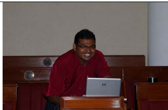
印度郭比每個中文字都認得