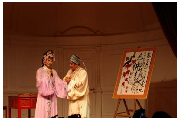
臺灣豫劇皇后王海玲詮釋風流倜儻的唐伯虎