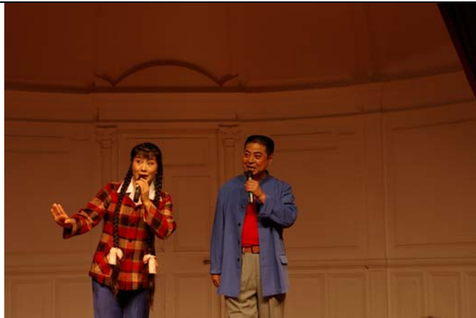
大陸一級演員王荃珍與孟祥禮演出朝陽溝選段