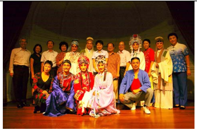
演出後演員與貴賓們合影