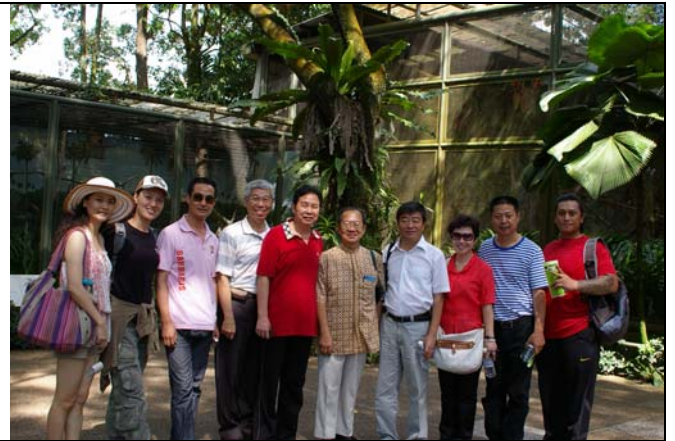
兩岸豫劇演員與新加坡戲曲學院一同郊遊