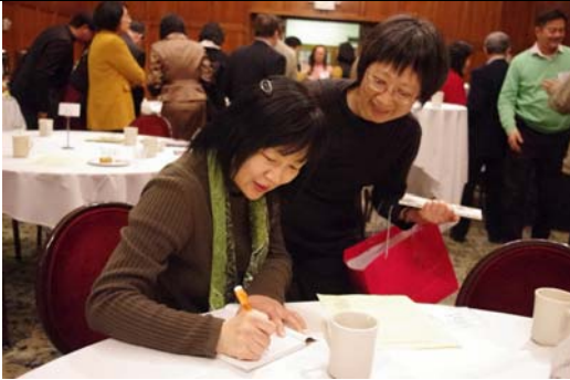
密西根大學演出後慶功宴。