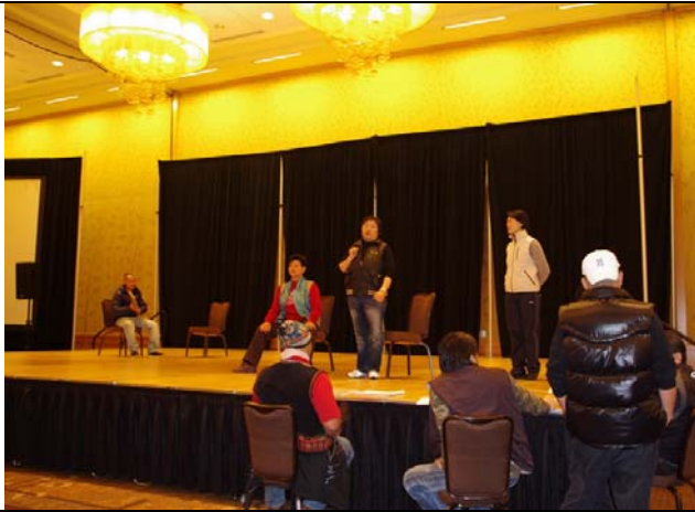
西雅圖演出前排練豫莎劇《約/束》。