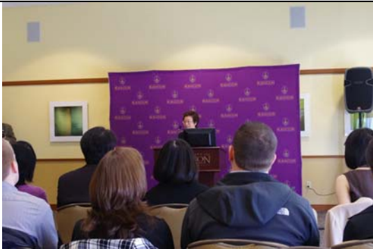
紐文許水仙主任積極幫忙臺灣豫劇團行銷。