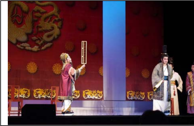
豫莎劇《約/束》演出精彩畫面。