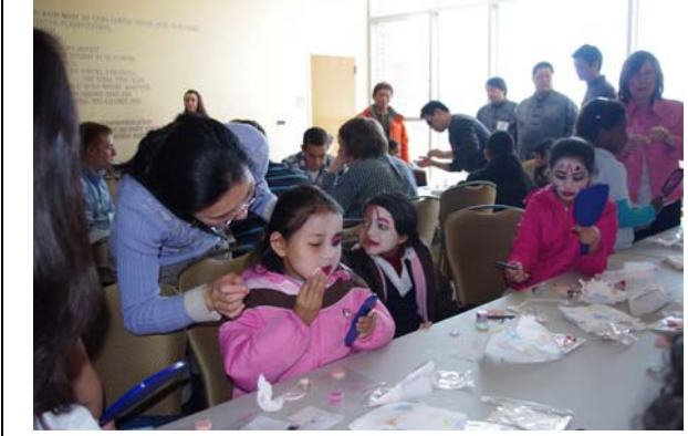
斯克蘭頓大學戲曲嘉年華臉譜體驗。