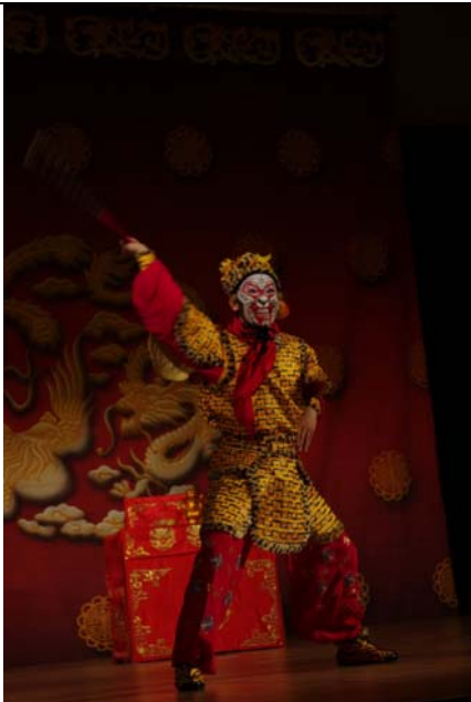
〈美猴王〉是外國觀眾熟悉的故事。