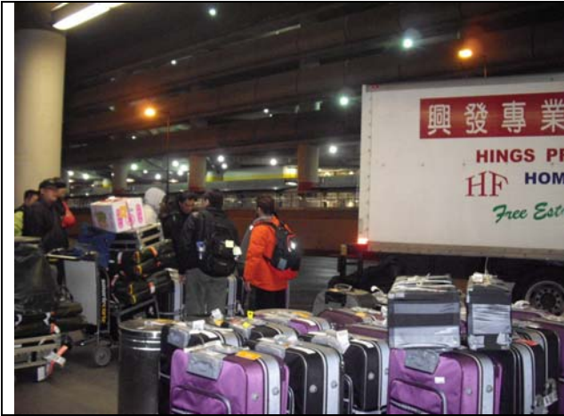
臺灣豫劇團抵達美國西雅圖。