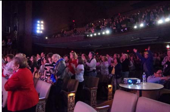
演出結束觀眾不約而同起立致敬。