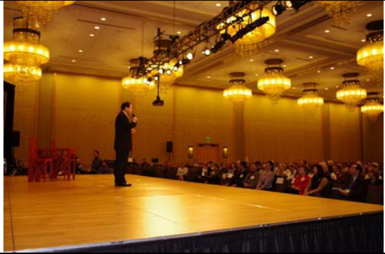
SAA 在西雅圖 HYATT 飯店辦理莎士比亞研討會定邀請臺灣豫劇團演出。