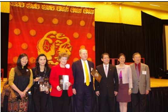
開演前邀演單位 SAA 與臺灣貴賓合影。