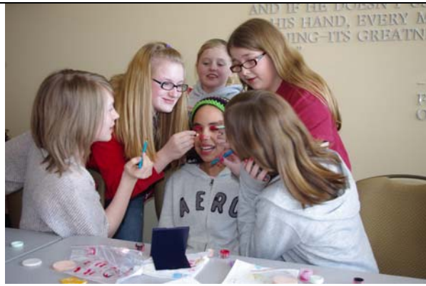
「毀容」小組格外盡興。