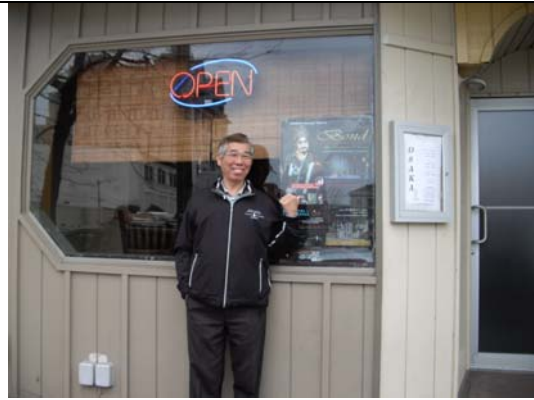
在斯克蘭頓日本料理店門口發現演出海報。