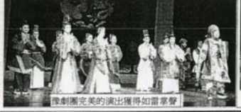
豫劇團完美的演出獲得如雷掌聲