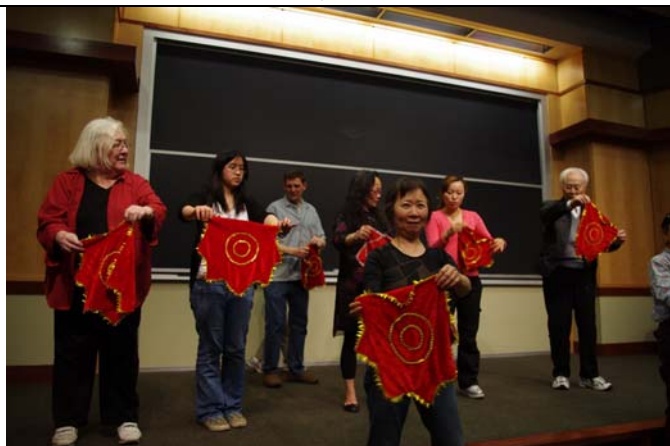
美國觀眾對戲曲手帕示範很感興趣。