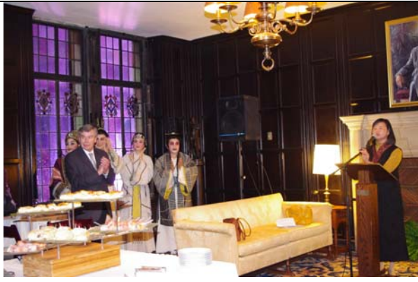
斯克蘭頓文化中心演出慶功宴。