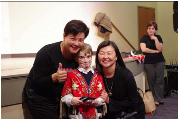
自由創作臉譜優勝者。