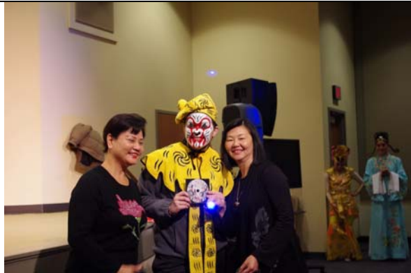
蘇團長與豫劇皇后一起頒獎給優勝者。