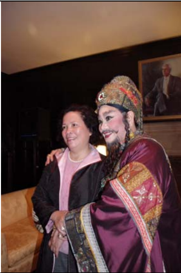
斯克蘭頓市華僑溫蒂熱心公益。