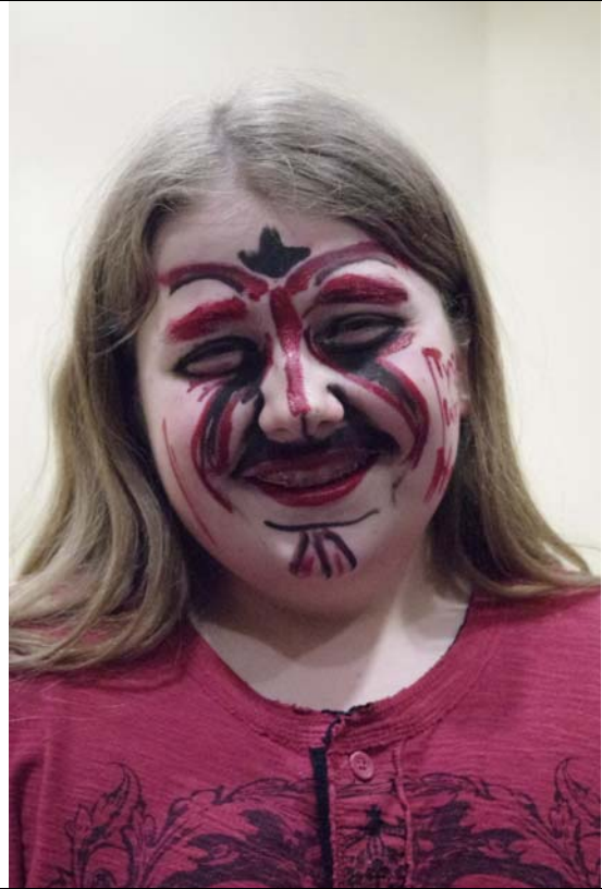
全心投入的參與者---難道是萬聖節到了嗎?