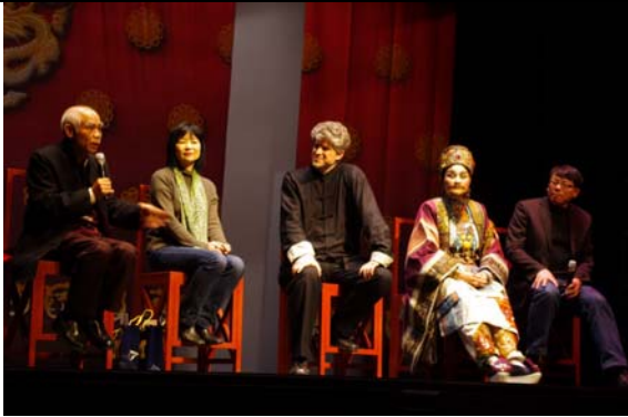
密西根大學演出後座談會。