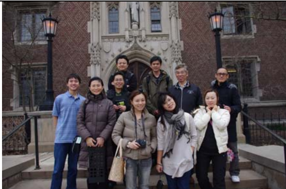
團員參加密西根校園導覽。