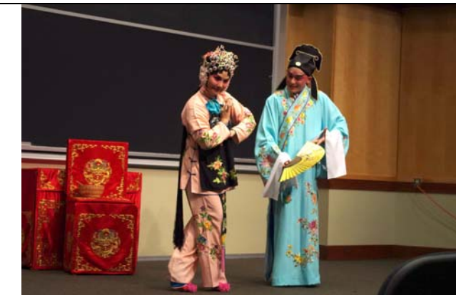
戲劇推廣示範講座演出〈拾玉鐲〉。