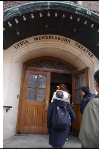
密西根大學演出劇場孟德爾松廳。