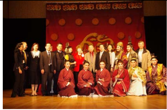
4月7日演出豫莎劇《約/束》演員與貴賓合影。