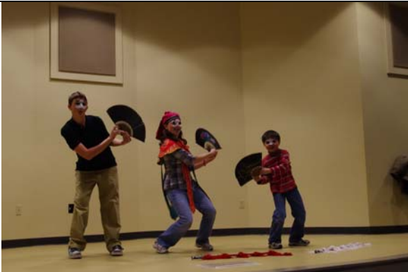
斯克蘭頓戲曲嘉年華武功體驗成果。