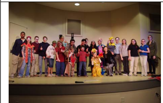
斯克蘭頓大學戲曲嘉年華大合照。