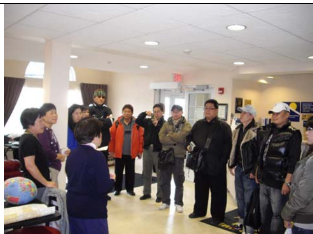
密西根大學城僑胞十分熱誠的接待。