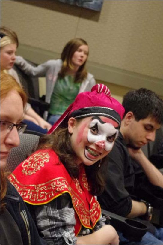
斯克蘭頓大學邀請社區民眾體驗戲曲之美。