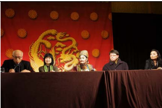
演出後的座談會是外國觀眾解惑的好機會。