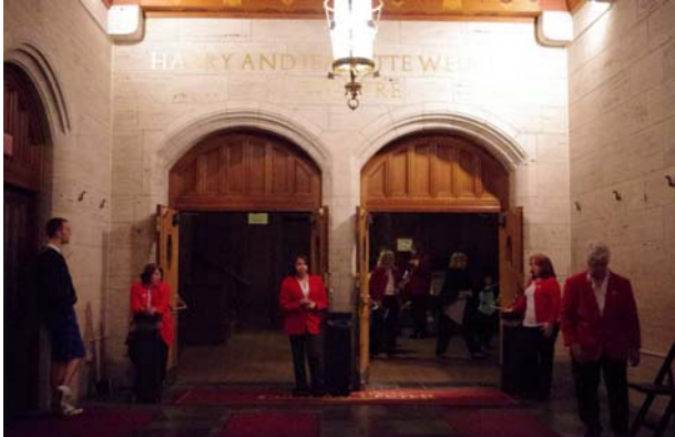
斯克蘭頓文化中心劇場十分典雅。