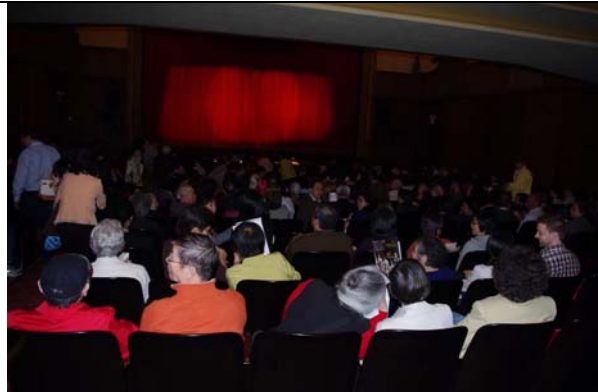
每場戲演出前都是座無虛席。