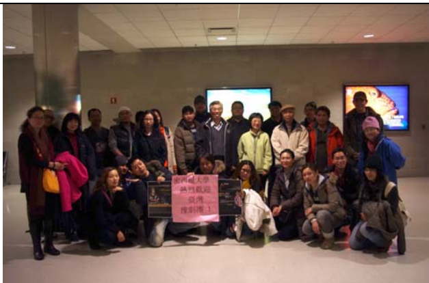
密西根大學城華僑團熱情接機。