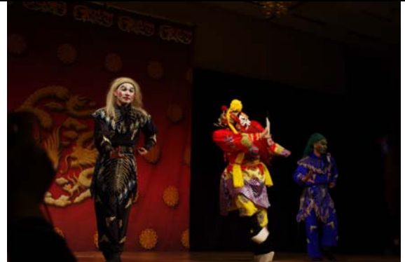
西雅圖台灣之夜演出十分精彩。