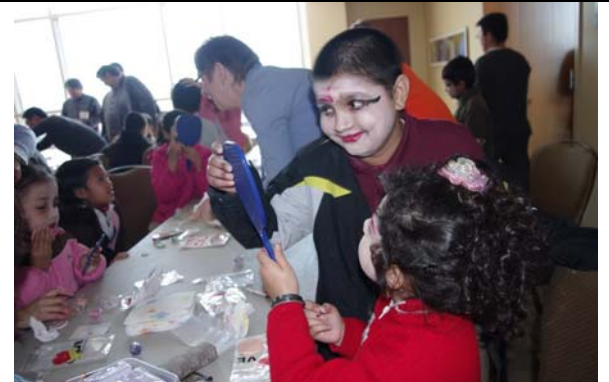
小朋友們在戲曲體驗中獲得許多快樂回憶。