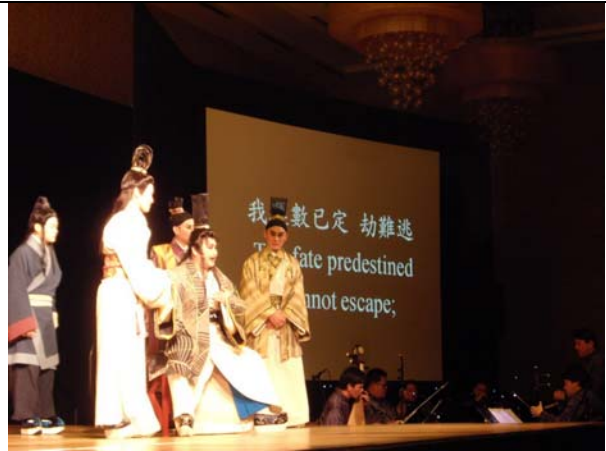
4月7日晚於西雅圖貝芙演出豫莎劇《約/束》。