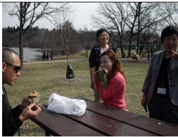
熱心的僑胞們提供熱騰騰的粽子供團員解鄉愁。