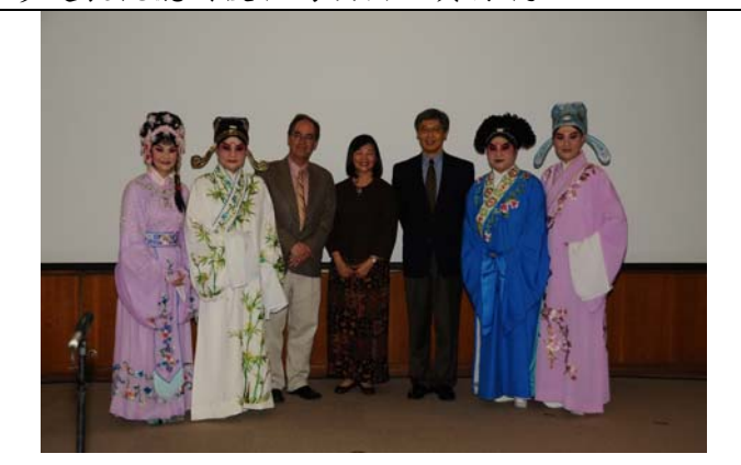
哈佛名校邀請臺灣豫劇團前往舉行演出講座。