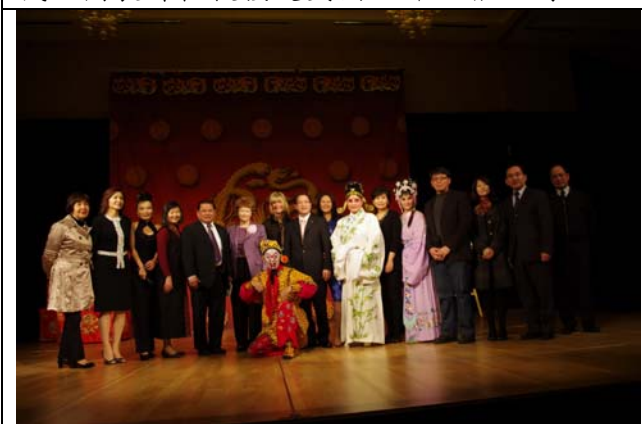
4月8日臺灣之夜演員與嘉賓合影。