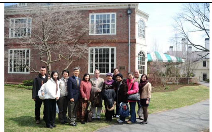
臺灣豫劇團成員在哈佛校園留影。