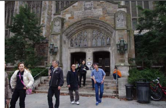
密西根大學美麗的校園。