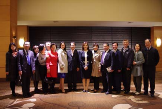
西雅圖華僑志工團是一支實力堅強的服務團隊，在此次演出中扮演極重要角色。