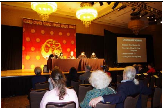
西雅圖演出後座談會吸引了極多來自各國學者。