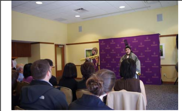
斯克蘭頓大學記者會中精彩演出。