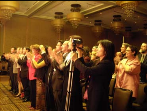
演出後外國觀眾起立喝采十分感人。