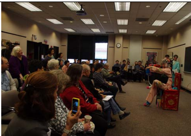
〈拾玉鐲〉演出示範三寸金蓮穿著。