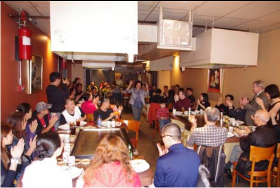
日本料理店老闆積極為臺灣豫劇團宣傳。