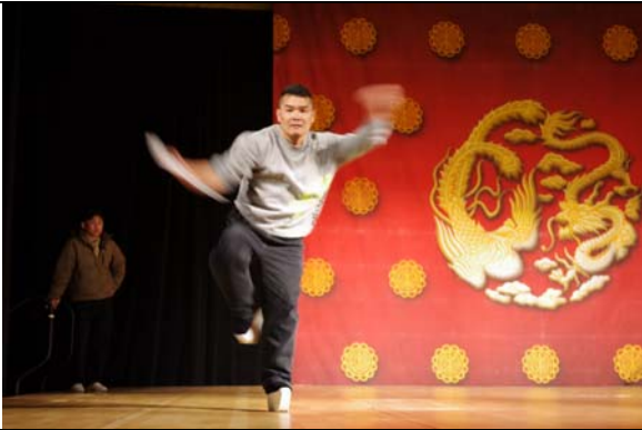
4月8日臺灣之夜演出排練。