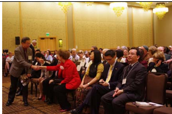
豫莎劇《約/束》演出前觀眾席已然客滿。