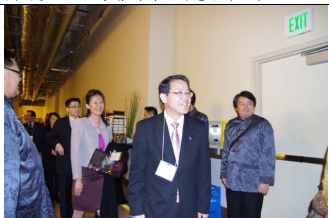
廖處長伉儷到後台為演出人員打氣。