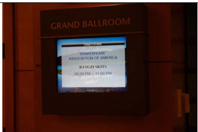
美國莎士比亞學會研討活動電子節目表。