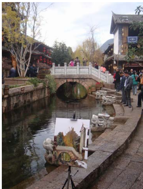
圖 31 麗江處處是風景畫

麗江古城於 1997 年列入世界文化遺產，位於雲南省的麗江納西族自治縣，始建于宋末元初（西元 13 世紀後期）。古城地處雲貴高原，海拔 2400 多米，全城面積達 3.8 平方公里，自古就是遠近聞名的集市和重鎮。古城現有居民 6,200 多戶，25,000 餘人，其中納西族佔總人口絕大多數，有 30% 的居民仍在從事以銅銀器製作、皮毛皮革、紡織、釀造業為主的傳統手工業和商業活動。麗江古城內的街道依山傍水修建，以紅色角礫岩鋪就，