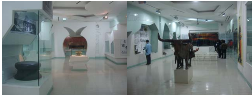
圖 13、14 雲南省博物館二樓展場一景及觸摸區的設計

借尚稱便利，在入館大廳的簡易服務台即可租借，押金為人民幣 100 元，租借費為人民幣 10 元，機具係使用先進的紅外