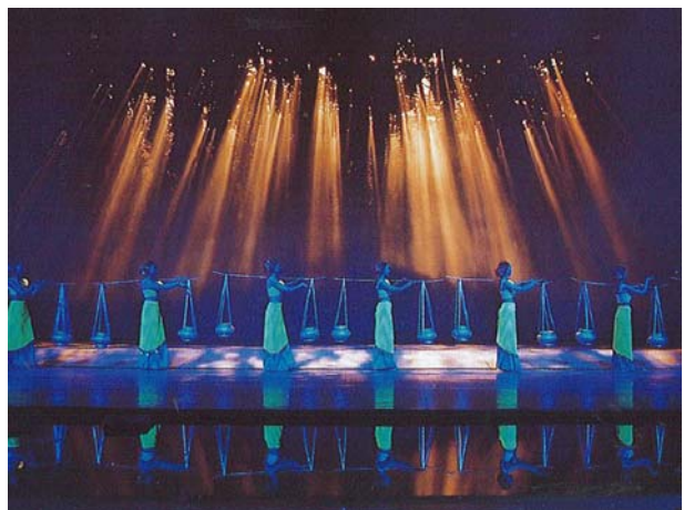
圖 44 傣族姑娘演出橋段

「序」將人們置身在一幅古老久遠的歷史景色中，窺探世界上僅存的象形文字：東巴文字；東巴祭司以獨特的方式講述歷史；而威嚴慈愛的雪山女神則以她特有的方式呵護著陽光如風的滇西北高原，與