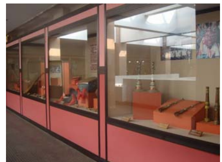
圖 19 〈民族樂器〉展間

雲南民族博物館於 1995 年 11 月開館，是中國大陸最大的民族博物館，與雲南省博物館一樣，同屬於中國大陸國家文物局於 2008 年公佈的首批 83 家國家一級博物館之一，也是雲南省榜上有名的唯二兩家博物館。館內的收藏包含雲南當地 26 個少數民族的服飾、工藝品、樂器等文物及資料。該館建築屬庭院迴廊式風格，分成兩層樓，由陳列館、科研辦公樓、藏品庫和手工作坊等組成，陳列館共有 16 間展室，6,000 多平方公尺展出面積以及 1 個演示作坊和畫