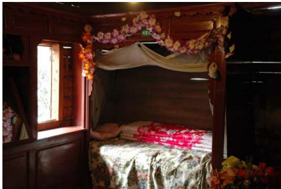
圖 2 摩梭人阿夏花房的陳設

民族村內湖光山色、鳥語花香，以「真實呈現」為建村宗旨，村內所有村寨之建築物原始材料及花草樹木，均由原地移建至此，甚至是各村寨內少數民族村民，亦從當地族寨內聘請而來，是中國大陸唯一原汁原味的民族村，可說是雲南民族的一個縮影。此外，民族村內每半個小時就有 30 分鐘的小型表演輪流在 26 個村寨輪番演出，所以不管在什麼時候入園，都可以在表演的村寨看到雲南少數民族的表演。同時，每日下午三時在雲南民族村滇池大舞台都有一場定時定點