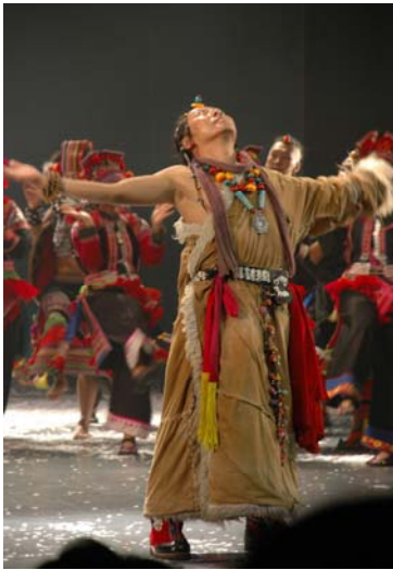
圖 38 「朝聖」演出橋段

由節目簡介中得知，〈雲南映像〉是享譽國際的舞蹈家「孔雀公主」楊麗萍費盡艱辛、耗時年餘，行遍雲南二十萬公里，尋訪、紀錄、採集原生態的珍貴民族歌舞，演出人員是花了楊麗萍一年的時間，翻山越嶺走遍雲南各大族寨，親自去挑選及邀約，這樣艱辛的過程，還必須扛起龐大的財務壓力，不是一般不食人間煙火的舞蹈家所能做到的！舞蹈演員中有 75% 來自雲南鄉土的農民，完全沒有舞蹈訓練的基礎，主要是希望他們在真實的舞台上，展現源自於內心、最原汁原味、最撼動人心的舞蹈。