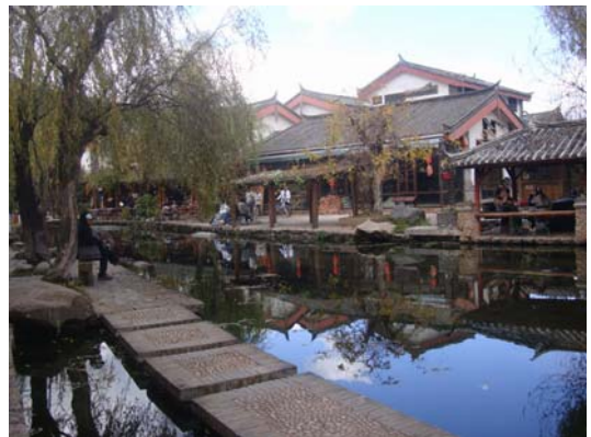
圖 34 束河古鎮是雲南六大影視基地之一

相較於麗江古城，束河古鎮環境較為清幽，商業化氣息較不濃烈，保存狀態也較為原始，具有發展成為生態博物館的良好條件，許