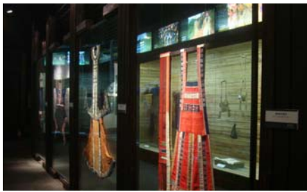
圖 22 〈民族服飾與製作工藝〉展間之服飾展示方式

該館因迴廊式建築之故，展廳相當分散，展場的維護狀態亦參差不一，某些文物的展示環境與保存狀況較為陳舊，像是〈民族樂器〉展間，且因該展間採自然光的設計，導致展櫃玻璃反光問題相當嚴重；此外，好幾間藝術家工作室於參訪時也呈現關閉狀態，據詢問係經費不足之故。目前維持較好，且佈展相當精緻的兩間展廳為〈民族文字古籍〉及〈民族服飾與製作工藝〉。