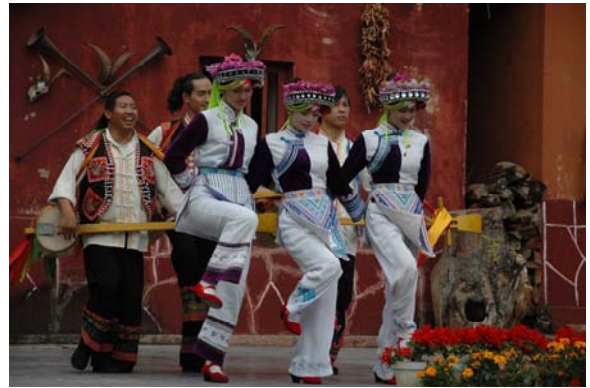
圖 3 彝族村內的小型演出

的大型民族情景主題「紅土鄉情」歌舞展演（約 60 分鐘），演出內容保留了原汁原味的民族舞蹈元素，採用歌舞樂技、民俗情景和大坪播映等多種演繹形式，借鑒與融合現代時尚娛樂元素，服裝設計和製作完全源自於各民族著裝的生活原型，大部分演員來自雲南當地少數民族，是傾民族村演藝資源打造的品牌演出；演出開始前 20 分鐘可看到全體演員在入口處列隊歡迎並招呼來自各地的觀眾儘快入座，就座後豪華大型的舞台即映入眼簾，為了避免觀眾久候不耐，舞台背後的大坪幕則不停的播放雲南民族村簡介及大型歌舞整個製作過程，讓觀眾在等待之時也可以進一步瞭解雲南民族村營運理念。正式表演節目內容則包括：「演藝