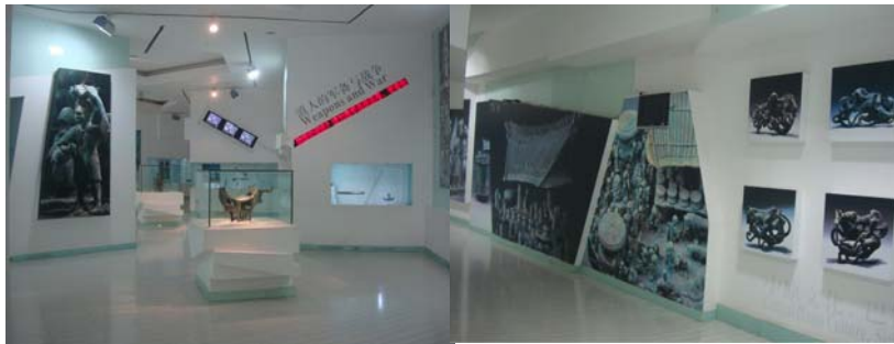
圖 11、12 雲南省博物館二樓展場設計