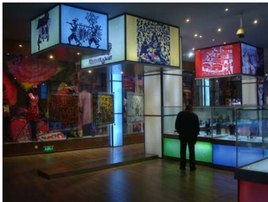
圖 15 傣族剪紙以懸掛於天花板之燈箱及垂掛之壓克力進行展示

相較於二樓，三樓的展覽〈記憶雲南—非物質文化遺產傳統技藝展〉運用了較多新穎的展示設計手法及新科技，本展自 2009 年起推出，展期長達三年。這個展覽可以說是雲南省境內 26 個主要少數民族的文化大觀園，其所呈現的各族傳統技藝及物件，都屬一時薈萃、