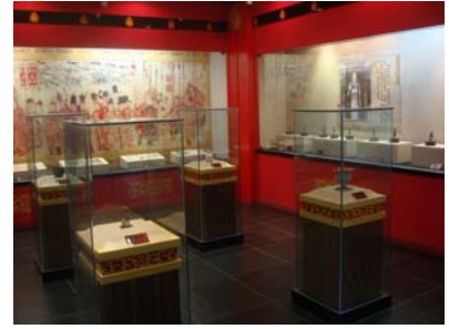
圖 30 崇聖寺三塔文物陳列館內部展示空間

崇聖寺三塔文物陳列館位於崇聖寺三塔園區內，崇聖寺距離大理古城約 1.5 公里，是南紹、大理國的皇家寺院，目前的主體建築於 2005 年重建，只有三塔歷經千餘年的天災及戰亂仍屹立不搖，更增添其神聖性。文物陳列館所舉辦的〈三塔出土文物展〉，展品量少而質精，展品「大鵬金翅鳥」更具有象徵地位。