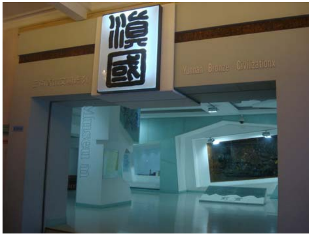
圖 8 〈滇國—雲南青銅文明陳列展〉展場入口

二樓展出的是〈滇國—雲南青銅文明陳列展〉，展覽主題以雲南滇國時期(前278年-115年)的青銅器為主，主要為考古發掘文物。本展獲得第七屆(2005-2006年度)中國大陸博物館十大陳列展覽精品評選精品獎，展品包括鎮館之寶「牛虎銅案」，這件戰國時期的文物亦即雲南省博物館館前廣場的