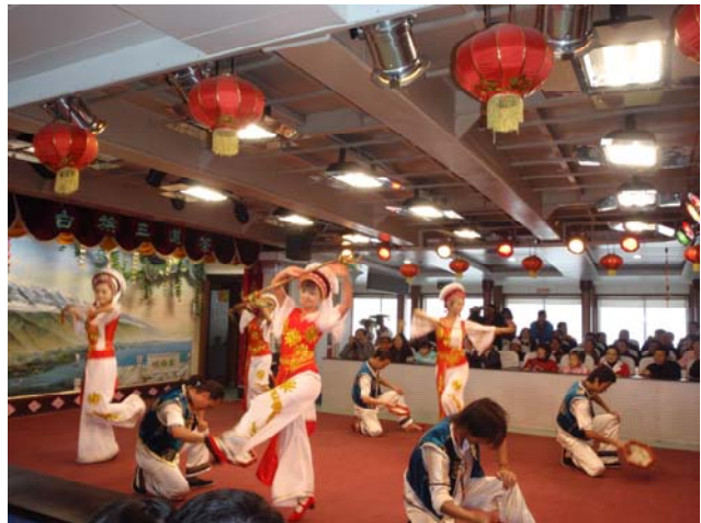
圖 39 大理白族民族歌舞及三道茶特色演出

大理『三道茶』緣起於長輩對晚輩的一種勉勵祝福。依據文獻最早見於唐代徐霞客《滇遊日記》，又據唐代樊綽《蠻書》的記載，南詔中後期和大理國時期，佛教興，寺廟中提倡坐禪飲茶，香客和遊客也喜歡飲茶止渴促使茶道進一步發展，隨著白族特殊的釋儒階層產