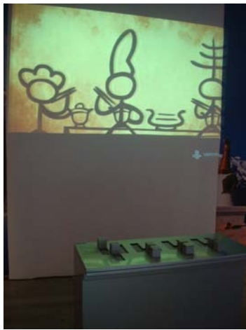
圖 16 東巴文互動遊戲區

此次的展覽為了呈現雲南少數民族多彩繽紛的風貌，整體展場的燈光設計亦是重點之一，並運用了情境布置的手法。教育推廣活動則穿插在展場動線間，包括東巴文的互動遊戲區、拓印區等；並且於天花板裝設感應式語音解說機，當觀眾經過下方時，語音機會自動啟動解說，壓克力罩可將聲音限縮在一定的範圍內，避免與展場的其他聲響互相干擾。