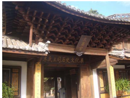
圖 32 〈木氏土司歷史文化展〉入口