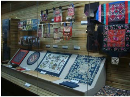
圖 21 〈民族服飾與製作工藝〉展間

根據該館科教部副主任邱文發先生表示，該館目前有 70 幾位館員，共包含 17 種少數民族，開館至今收藏有 4 萬多組件藏品，每年參觀人數為 10 幾萬人。