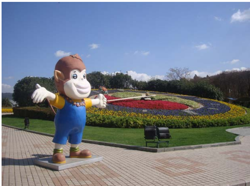
圖 24 世博園內的大花鐘

昆明世博園在會展期間曾創造將近千萬人次的遊客紀錄。2000 年 3 月，雲南省政府將世博局改組為雲南世博集團總公司，下屬 14 個分公司，將整個世博會會址及全