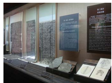
圖 20 〈民族文字古籍〉展間