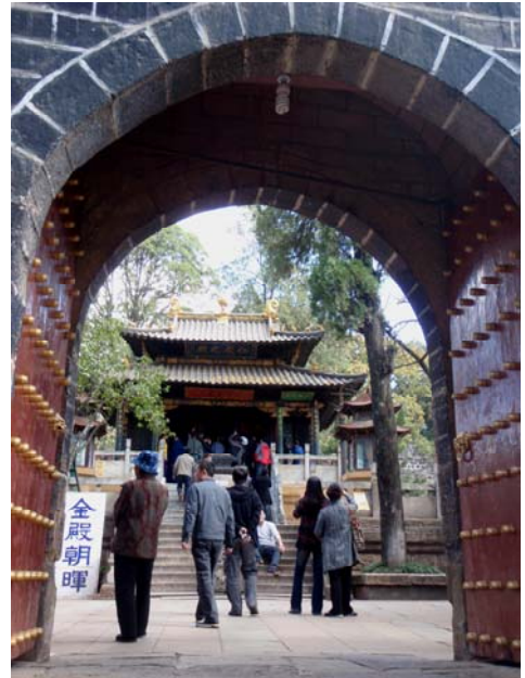
圖 25 金殿入口，後方即為金殿

金殿風景區位于昆明東郊的鳴鳳山麓，距市區 8 公里，初建于明萬曆年間，明崇禎十年（1637）銅殿遷賓川雞足山，清康熙十年（1671）平西王吳三桂重建現存這幢重簷歇山式真武銅殿，包括樑柱斗拱、瓦楞頂檐、神像羅幔、桌案瓶器、匾楹旌旗等等均用銅鑄成，殿樑上還留有「大清康熙十年，歲次辛亥，大呂月，十有門日之吉，平西親王吳三桂敬築」等字樣。金殿的階梯、地板、欄杆均是別緻的大理石鑲砌。整個殿宇宏偉莊嚴，美觀大方，殿外築有城牆、城門、城垛。城上有樓。金殿是中國大陸最大的銅建築，比北京頤和園萬壽山的金殿保存更完整，比湖北武當山金殿規模大，銅殿在驕陽下殿宇熠熠生輝，耀眼奪目，故人