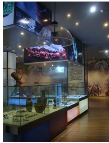
圖 18 感應式語音解說機