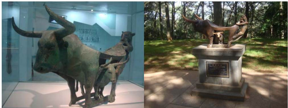
圖 9、10 雲南省博物館鎮館之寶「牛虎銅案」及昆明市郊金殿園區內的複製品

複製品，是雲南青銅文化的代表之作，於1995年被國家文物局鑑定專家訂為國寶級文物，值得一提的是，這件文物不僅在館內可以看見其真跡，在參訪昆明市各區時也看見許多不同尺寸的複製品，讓民眾潛移默化中熟悉此件文物，藉此進行推廣，也滿足了中國