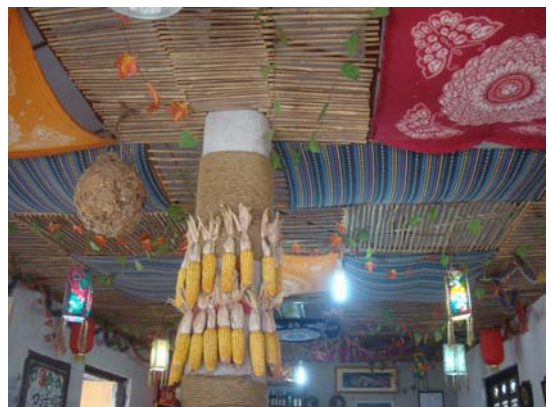
圖 35 染布與織布是雲南少數民族的日常生活用品，此處用於裝飾天花板