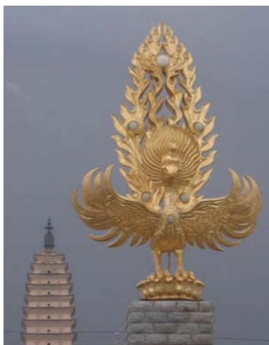
圖 29 崇聖寺大塔前的大鵬金翅鳥立像