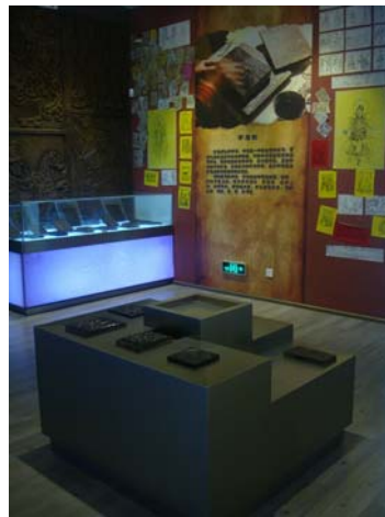
圖 17 拓印區