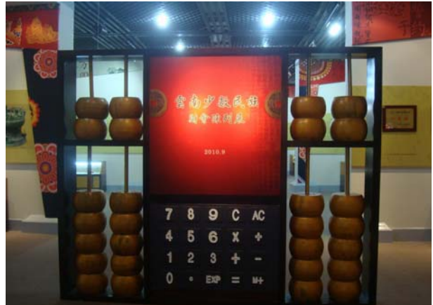
圖 7 〈雲南少數民族財會陳列展〉入口意象

主題實不多見，且乍看之下或許不吸引人，財務與會計在現代複雜社會中已經形成刻板印象；然而從民俗生活的角度來看，回到少數民族較為單純的生活方式，財務與會計究其原意，無非是一種計算、交易、誓約與紀錄的方式，本展即展出少數民族傳統財務會計的文化精髓，展品包括貝幣、結繩記事、瓦貓等具民族特色的四百餘件展品。