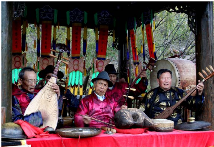
圖 40 東河古鎮的納西古樂演出

演奏納西古樂的樂隊所使用的樂器，按照演奏方式的不同可以分為三個樂器組：一為吹管樂器，有豎笛、橫笛、波伯；其中橫笛