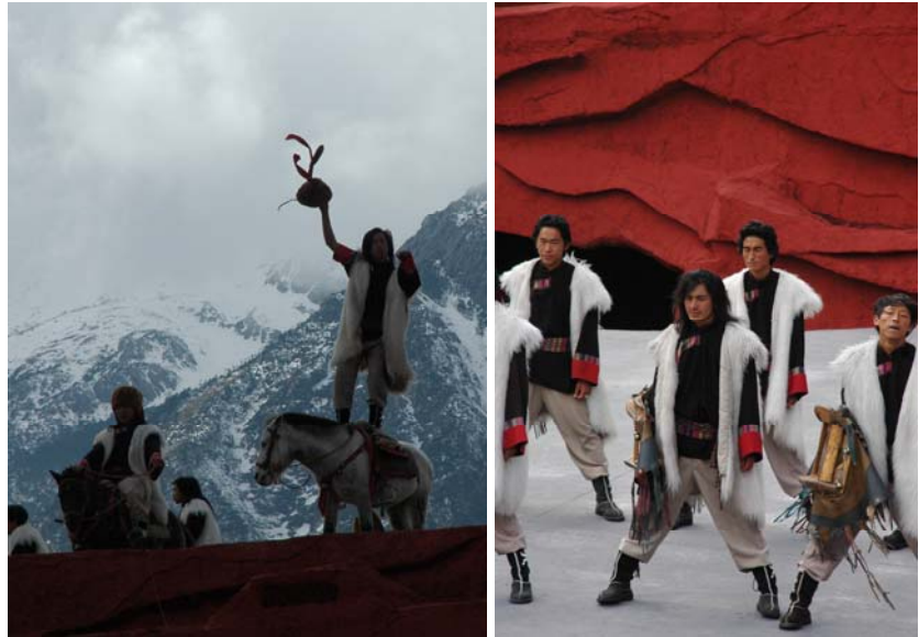
圖 42、43 印象麗江表演橋段

一會兒百馬奔馳、一會兒鼓號震天、一會兒對歌競舞、一會兒深情款款，將少數民族豪邁的滇川文化，淋漓盡致的展現在觀眾面前。演出在白天進行，在「光天化日」之下，