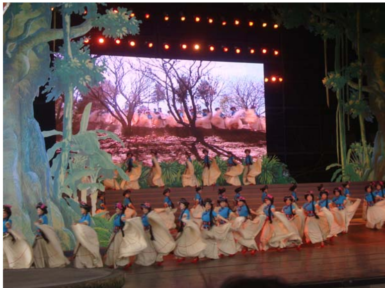
圖 5 雲南民族村大型情景歌舞「紅土鄉情」演出片段

「色塊篇：重彩盛裝」、「尾聲篇：留客之歌」等9場，因舞台、布景是專為這場演出所設計的，故整體演出、各場次串場連接搭配的相當流暢，再加上現代燈光音響的輔助，演出有種大型的歌舞秀的感覺，視覺效果極