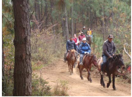
圖 36 茶馬古道的體驗經濟

東河古鎮是茶馬古道上的重要驛站，茶馬古道是雲南、四川、西藏間的古代貿易通道，不僅是交通要道，更具有文化交流的價值。從雲南往返西藏，騎馬來回必須花費半年的時間，中間的困難險阻實難為外人道也。當時的艱辛成為當今社會的一則傳奇，行走在東河古鎮的街道上，時常碰到納西族人牽著馬匹，詢問遊客是否想要騎馬體驗茶馬古道之旅。這種約莫一個多小時的騎馬行程，