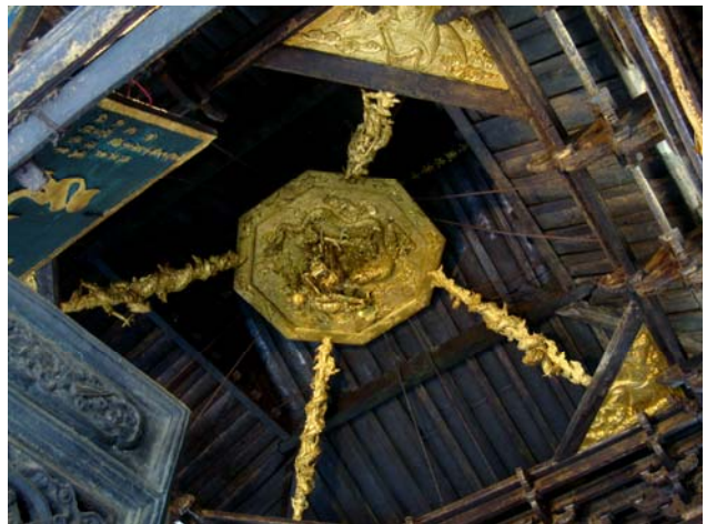
圖 26 金殿殿樑上留有當年吳三桂的親筆字跡