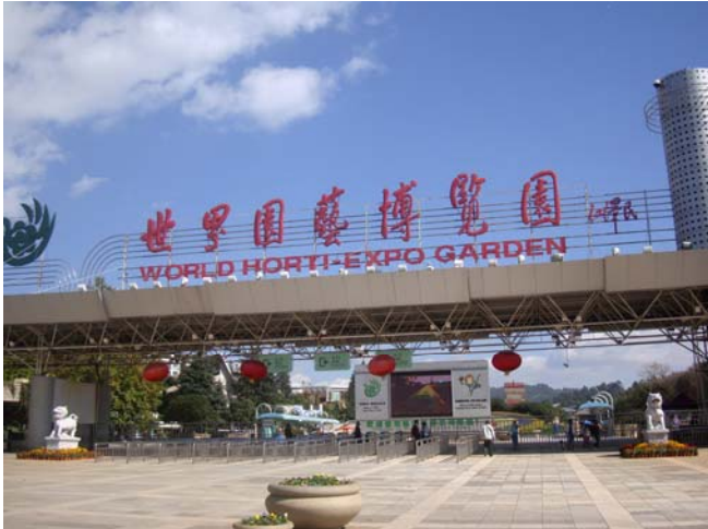
圖 23 世界園藝博覽園位於昆明市東北郊區

覽基地之基礎上，努力發展成為中國全國文明風景旅遊區示範點，並獲得首批評定的 4A 級旅遊區稱號。園區設在昆明市東北郊的金殿風景名勝區，園區占地面積約 218 公頃，結合地勢特點，依山就坡，採取組團式的結構佈局，通過軸線組織、空間創造，使各功能區