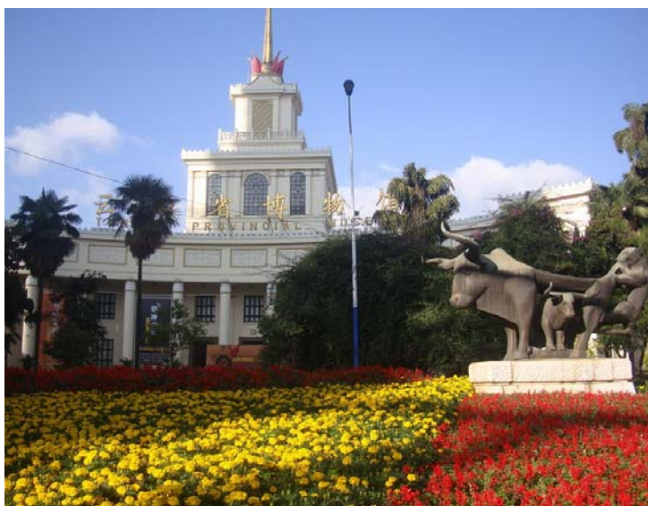
圖 6 位於昆明市中心的雲南省博物館

雲南省博物館位於昆明市中心，是一座綜合性博物館，創建於 1951 年，展廳共分三個樓層，面積共 4,200 平方公尺。雲南省博物館屬於中