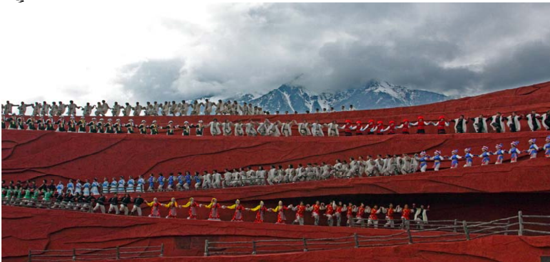
圖 41 劇場以玉龍雪山為背景、藍天為幕帳、豔陽為燈光

由大導演張藝謀所策劃的第二部實景舞台演出，在麗江海拔3,100公尺的大型戶外圓形劇場上，用象徵著雲貴高原紅土的紅色砂石砌成了12米高、迂迴艱險的「茶馬古道」，以神山玉龍雪山為背景，抬頭