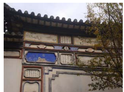
圖 28 白族建築的粉牆畫壁