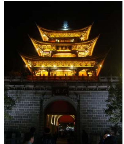
圖 27 大理夜色中的五華樓