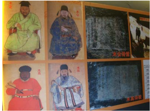
圖 33 納西族首領木氏自元代起世襲麗江土知府

早在麗江被指定成為世界文化遺產之前，其綺麗的人文風景就吸引了大批的外國背包客到訪，待成為世界文化遺產，更是舉世皆知，觀光客從早到晚充斥在古城街頭，觀光為麗江帶來了經濟生機，然而也改變了當地少數族群的生活方式。麗江古城內的商家已愈來愈多由外來人口經營。世界文化遺產的頭銜為麗江帶來了生態保存的生機和經濟效益，然而，對少數民族生活的改變卻是不可逆轉的過程，其生活情景已改變很多，麗江古城每到夜晚，喧鬧的流行音樂聲充斥耳邊，與古鎮幽雅的風貌非常不搭調。不過，儘管其已成為相當商業化的觀光地，其所具有歷史文化價值仍無法取代。