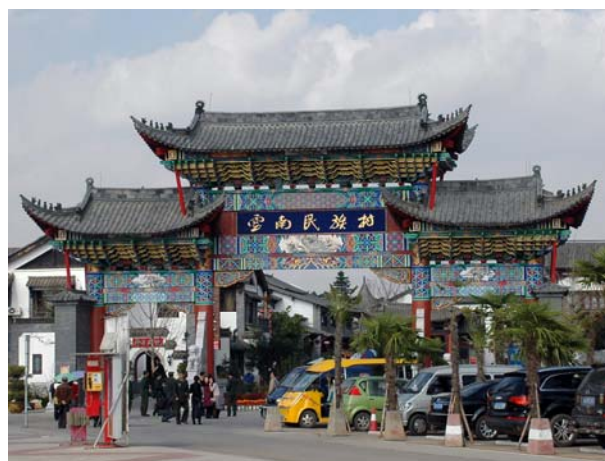
圖 1 雲南民族村是昆明最主要的文化主題樂園

雲南民族村位於昆明市南 6 公里，占地 2,000 畝。它南臨浩瀚的滇池、北望歷史文化名城昆明，西靠著名的西山風景區，湖光山色秀美無比。民族村內將雲南的 26 個民族各建一個村寨，重現各個少數民族風土民情與特色