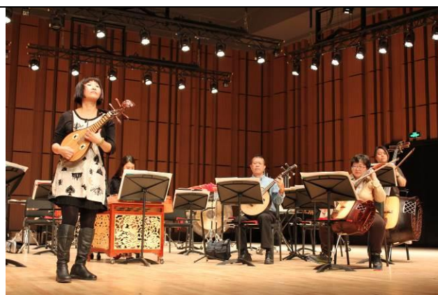
NCO 全體團員於浙江音樂學院音樂廳演出前 總彩排(2016.11.11)