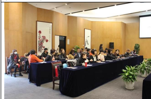
NCO 全體團員與浙江音樂學院中國音樂學系 進行學術交流。(2016.11.11)