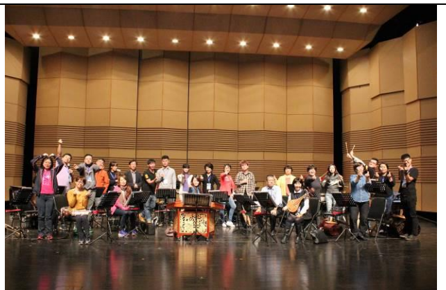
NCO 全體團員於杭州劇院演出前總彩排 (2016.11.12)