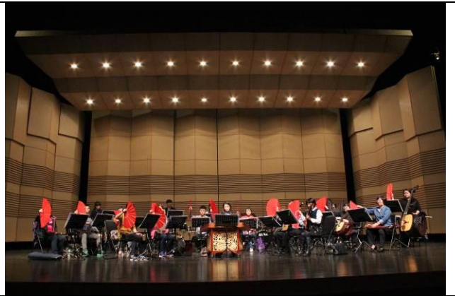
NCO 全體團員於杭州劇院演出前總彩排 (2016.11.12)