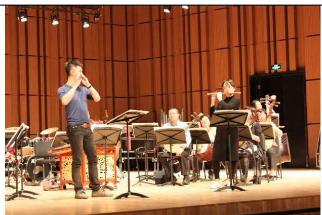
NCO 全體團員於浙江音樂學院音樂廳演出前 總彩排(2016.11.11)