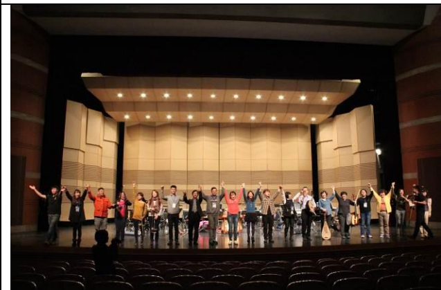
NCO 全體團員於杭州劇院演出前總彩排 (2016.11.12)