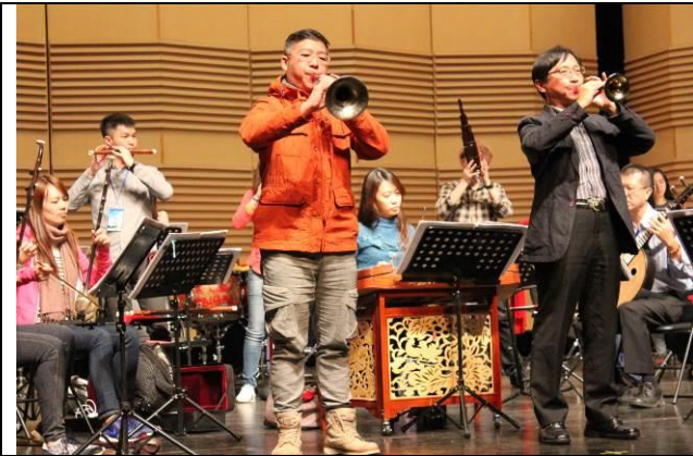
NCO 全體團員於杭州劇院演出前總彩排 (2016.11.12)