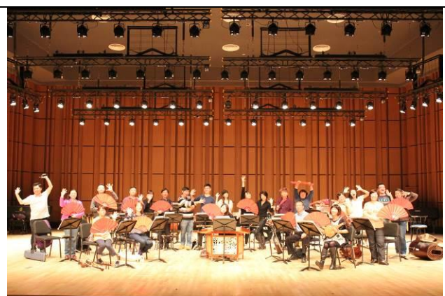
NCO 全體團員於浙江音樂學院音樂廳演出前 總彩排(2016.11.11)