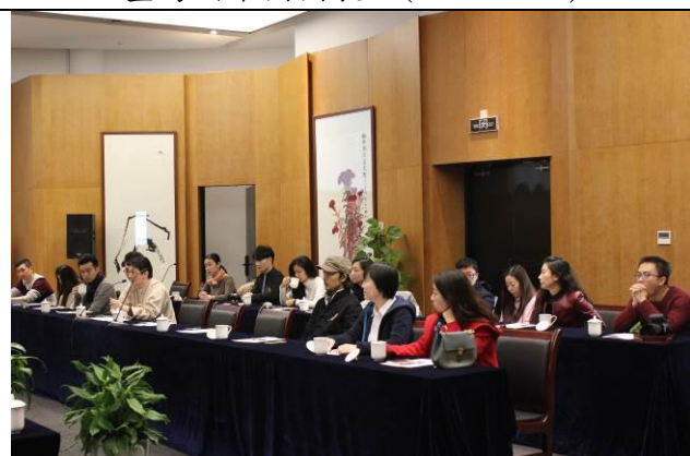
NCO 全體團員與浙江音樂學院中國音樂學系 進行學術交流。(2016.11.11)