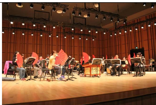
NCO 全體團員於浙江音樂學院音樂廳演出前 總彩排(2016.11.11)