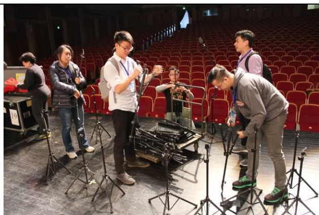
NCO 全體團員於杭州劇院總彩排前裝台 (2016.11.12)