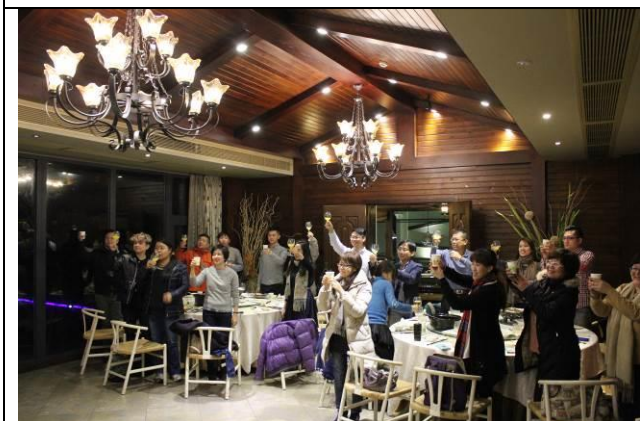
NCO 全體團員感謝浙江文化廳接待。 (2016.11.10)