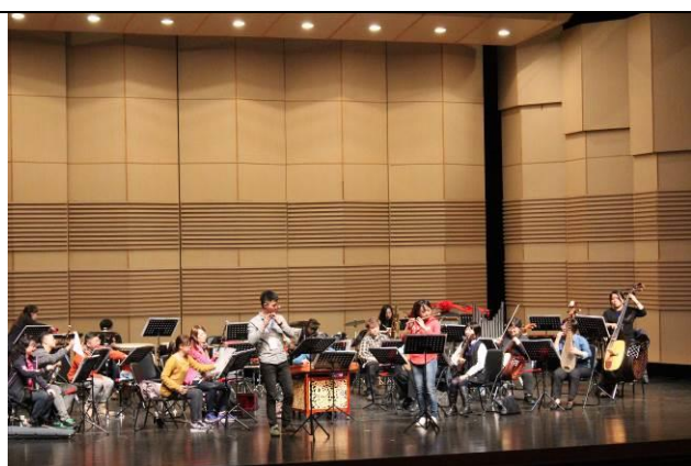
NCO 全體團員於杭州劇院演出前總彩排 (2016.11.12)