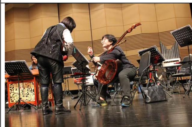
NCO 全體團員於杭州劇院演出前總彩排 (2016.11.12)