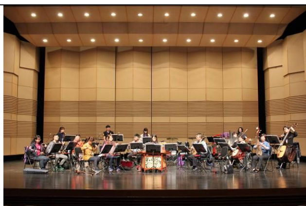
「NCO 全體團員於杭州劇院演出前總彩排 (2016.11.12)