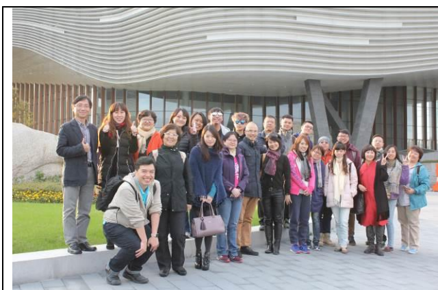
NCO 團員於浙江音樂學院門口留念。 (2016.11.10)