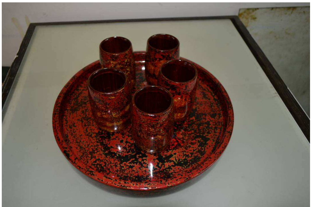
本課程可完成 5 個漆杯作品 1 個漆盤作品

註：1. 需自備圍裙、袖套、衛生紙、報紙、美工刀、鉛筆、原子筆、抹布（儘量是不要的衣服）、手套（檢驗室用的）、剪刀，其他如需準備上課後會再通知。