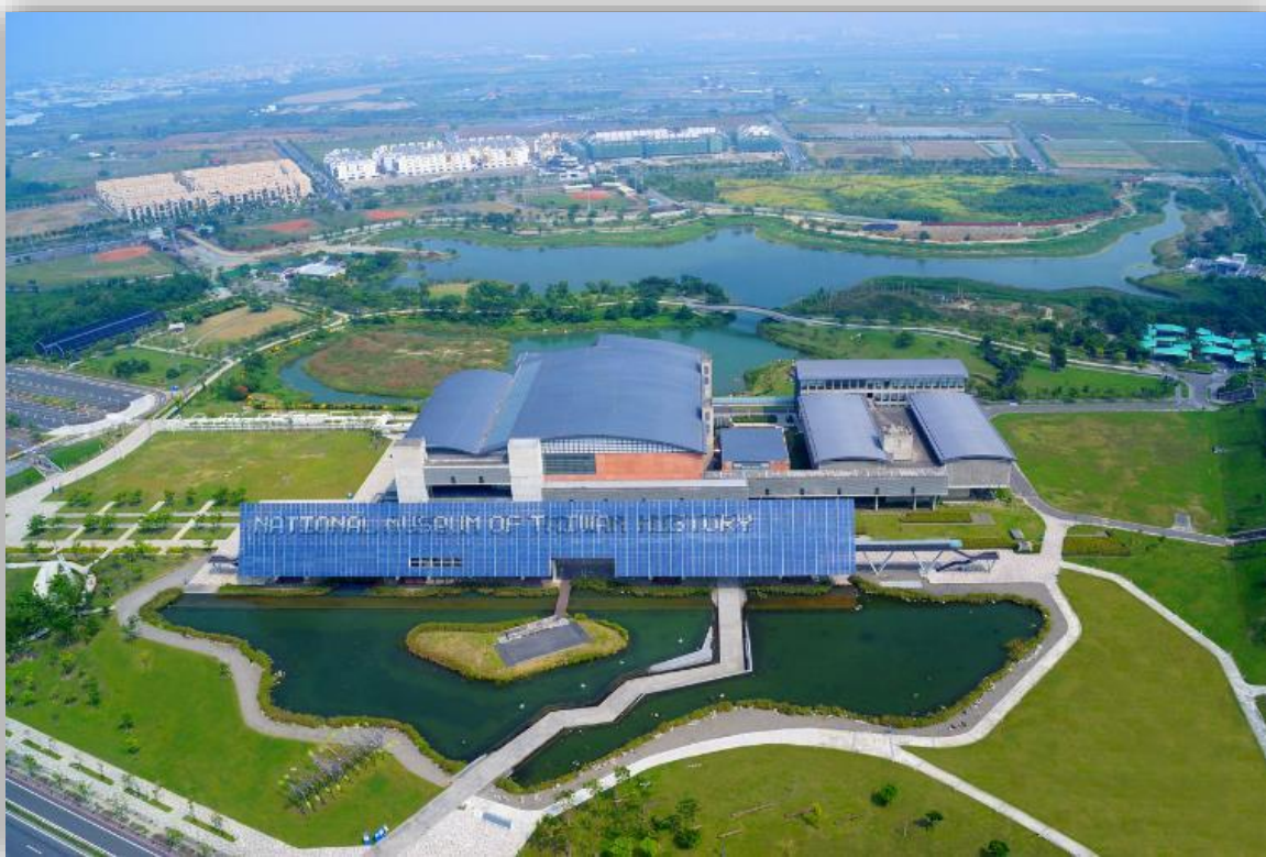
觀照歷史，落地生根，建構願景，多年有成

臺史博的誕生，始於 81 年前總統李登輝與前省主席連戰訪視臺灣省立博物館，指示臺灣省政府教育廳籌建「省立歷史博物館」。87 年，臺灣省政府文化處正式成立「省立歷史博物館籌備處」。88 年配合精省，改隸行政院文化建設委員會(現文化部，以下稱文建會)並更名為「國立臺灣歷史博物館籌備處」，96 年奉准正式成立中央四級機關「國立臺灣歷史博物館」。歷經十數年的籌劃及興建，在 100 年 10 月 29 日以嶄新的面目敞開大門迎賓，至 105 年 6 月底，累計入館參觀人數已逾 355 萬人次。