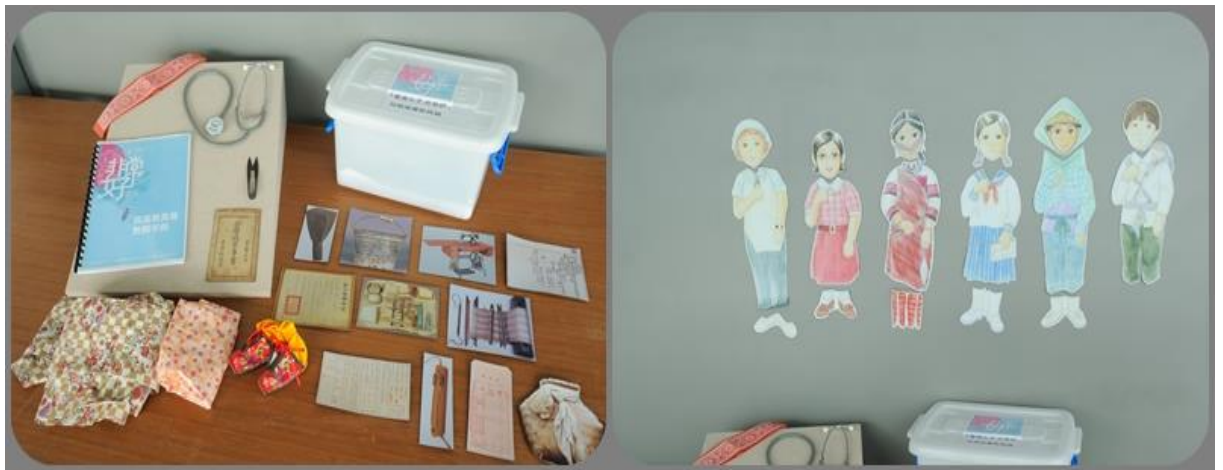
「臺灣女人」教具箱，免費提供學校教師外借教學，培養學生性別敏感度與多元價值觀

104 年辦理「聽你看我：認識多元文化工作坊」，邀請女性新住民分享臺灣的生活經驗、文化衝擊以及其所面對的挑戰與困難；105 年並進而規劃製作新住民教具箱，透過女性新住民原生家庭及婚嫁等生活物件，呈現不同國家新住民個人生命史和民族文化，尊重差異、多元社會及認知文化多樣性，消除偏見及刻板印象，從而悅納自己和他人。