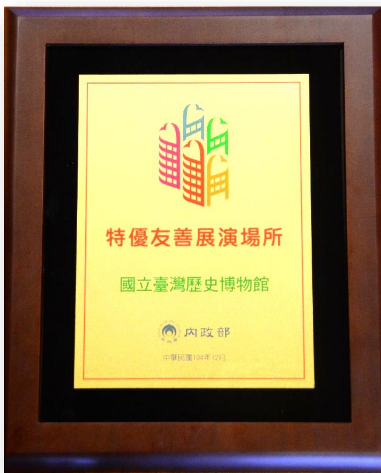
臺史博於 104 年榮獲內政部特優友善展演場所認證

臺史博累積在友善平權的多年努力，於 104 年榮獲內政部特優友善展演場所認證，在得獎的一百多個公私立單位中，是唯一榮獲特優級的友善展演場所。臺史博並以此為基礎，持續營造適合多元群體參與、體驗與學習的友善環境，讓前來參觀的每一個人都能享有均等的學習互動機會，致力成為「友善平權的博物館」。