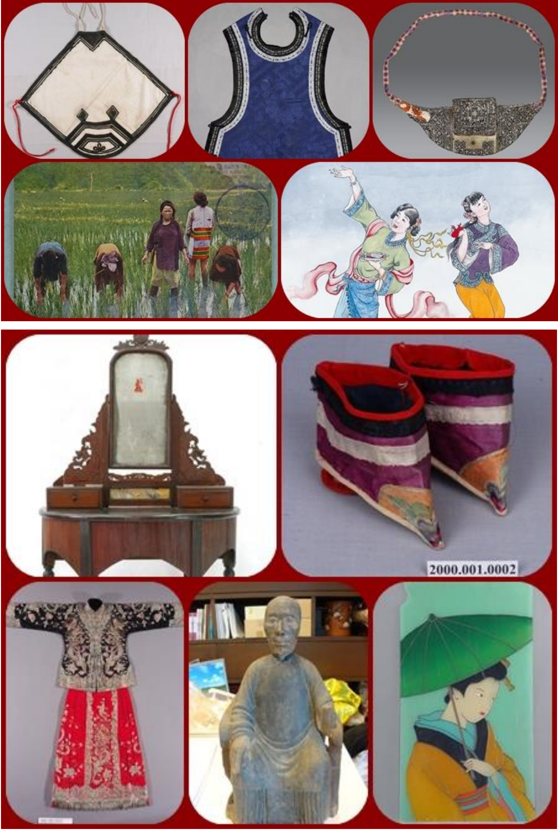
臺史博蒐藏豐富的女性史料