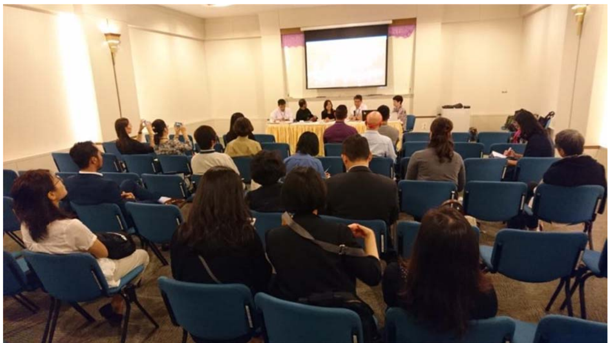
本中心所主辦的亞太傳統藝術節論壇