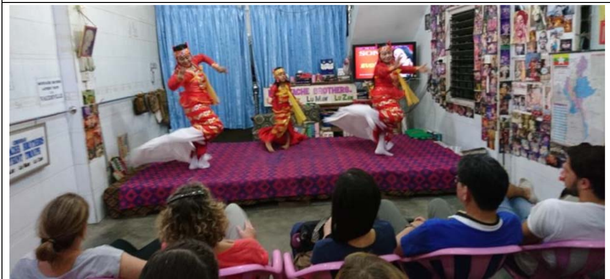
家族成員演出傳統舞蹈