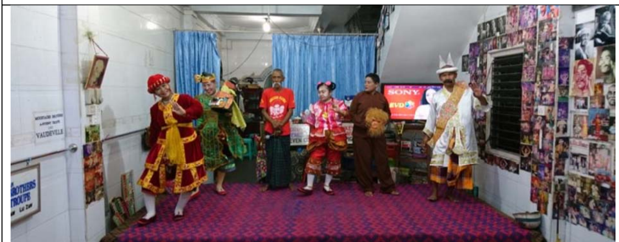
演出者皆為家族成員