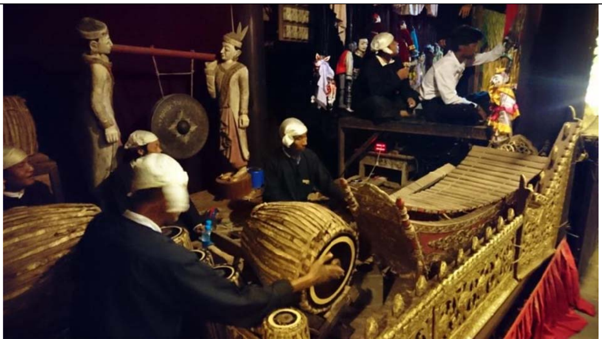
演出由現場樂隊伴奏