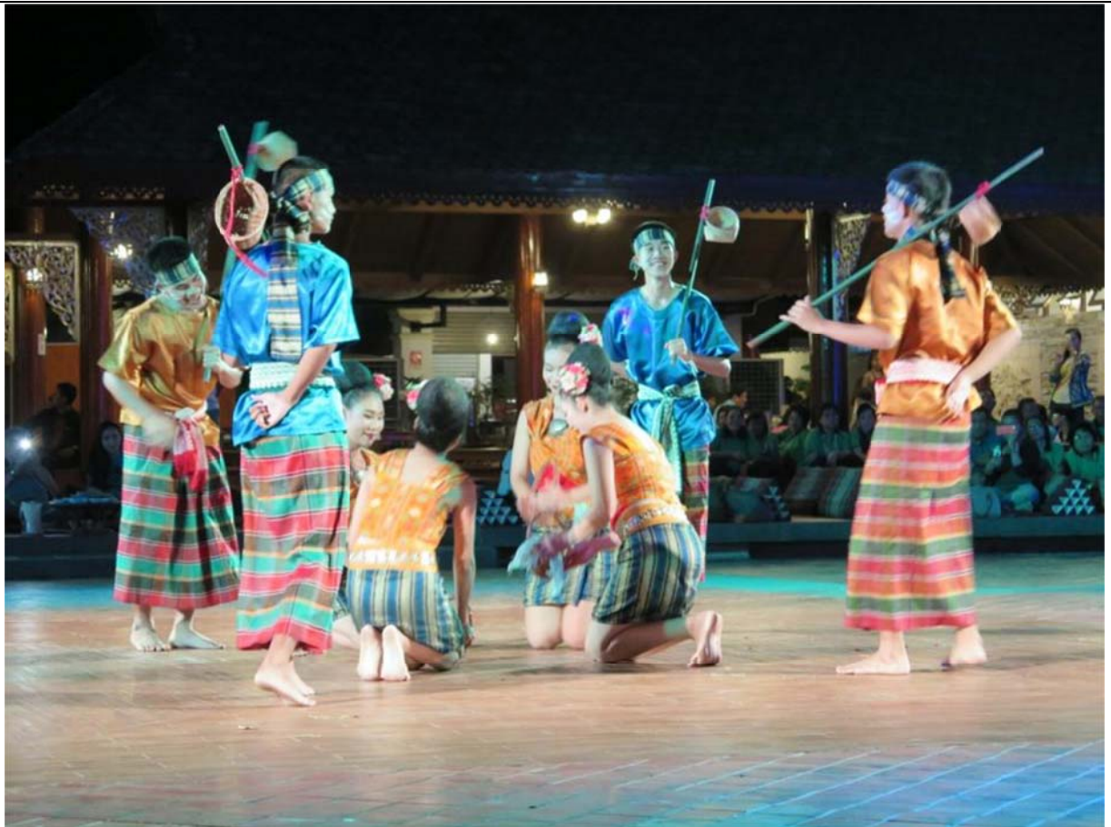
演出蘭納地區傳統民間舞蹈