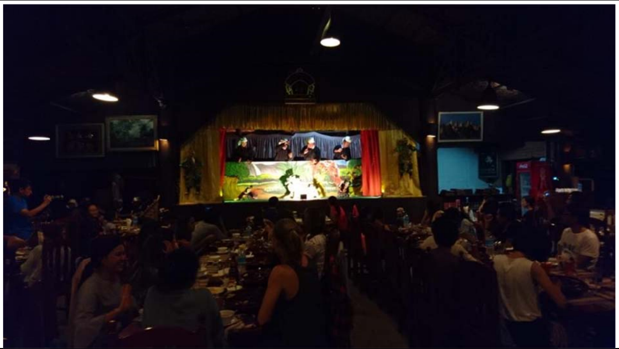
南達餐廳高朋滿座