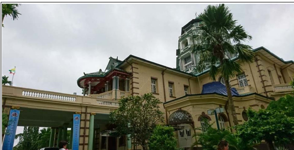
仰光藝術高中校舍原為宏偉的華人古蹟宅第