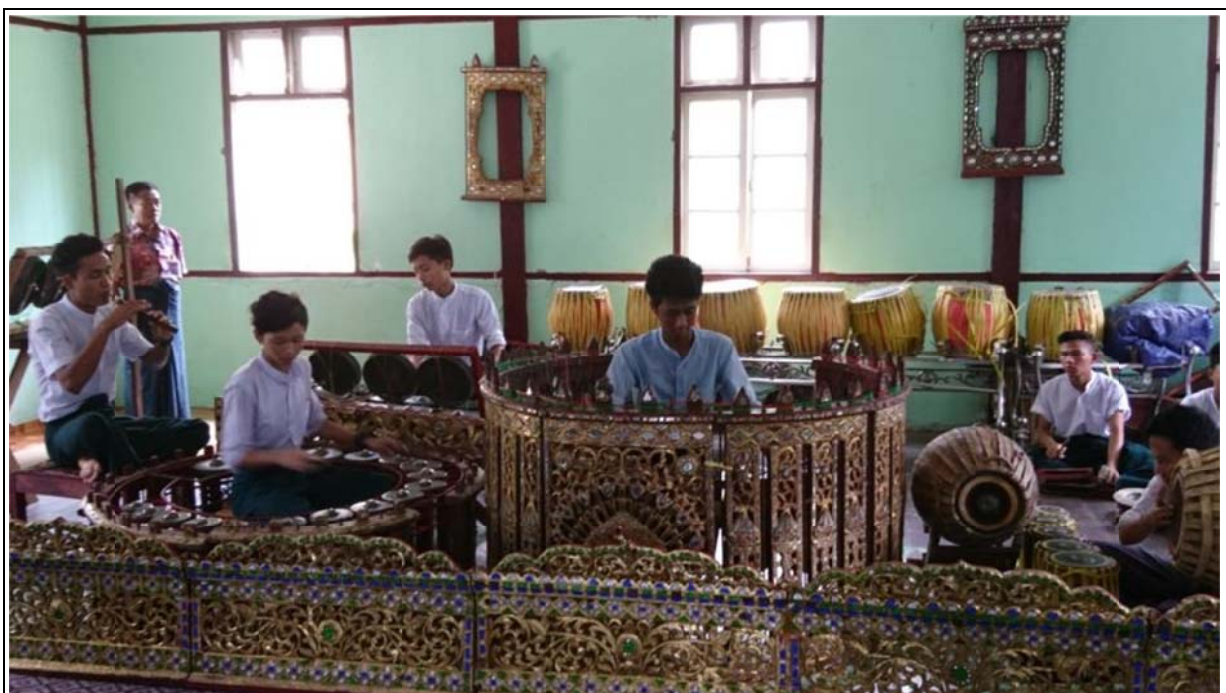
音樂系學生演奏緬甸傳統樂曲迎賓