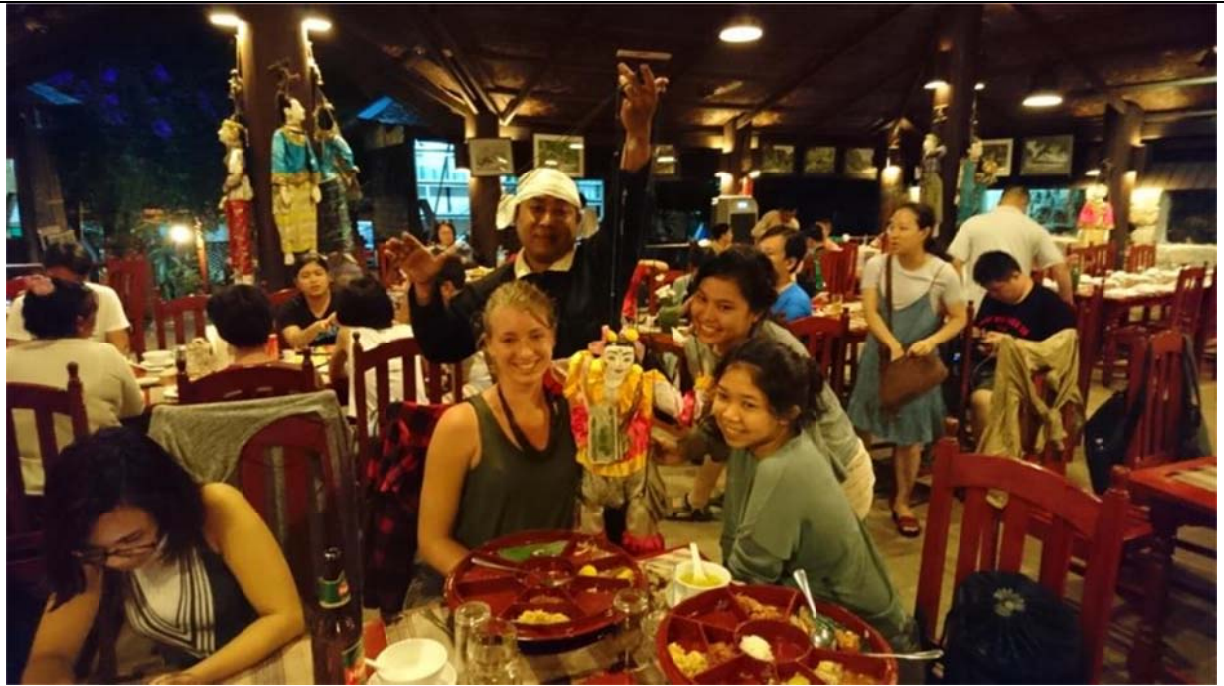
演後操偶師會穿梭觀眾席與遊客合影