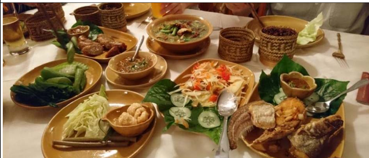
Kualao Restaurant 提供寮國道地風味餐點