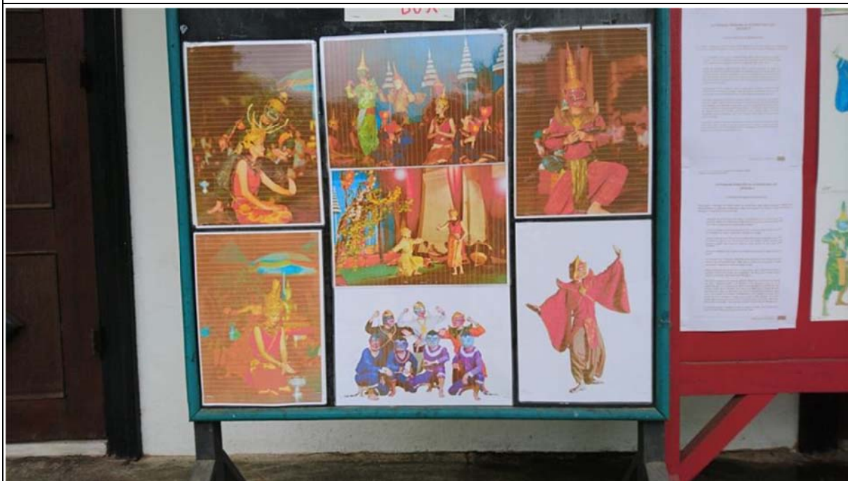
由皇家芭蕾舞團（Royal Ballet Theatre）演出取材自羅摩衍那的傳統舞蹈