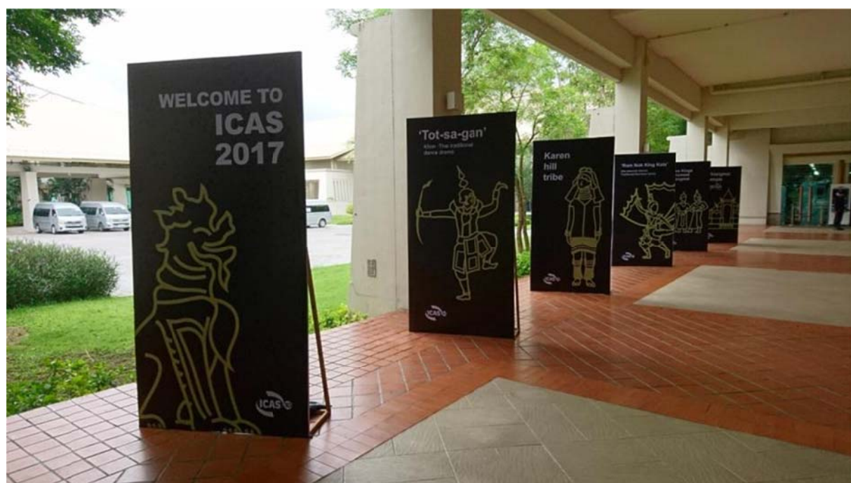
第 10 屆 ICAS 年會於泰國清邁國際展覽及會議中心舉行

本次論壇吸引許多國際藝術工作者前來聆聽，包括 Cambodian Living Arts、Institut Français-Cambodge 等機構人士，會後皆表示高度的交流意願，為未來的連結網絡埋下契機。