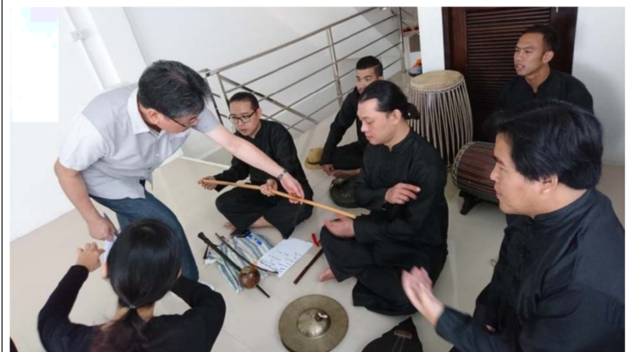
樂師介紹蘭納傳統樂器