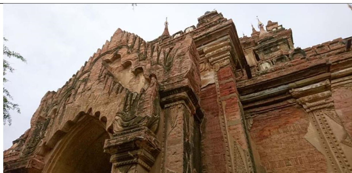
瑞雷杜佛塔 (Shwe Lake Too)