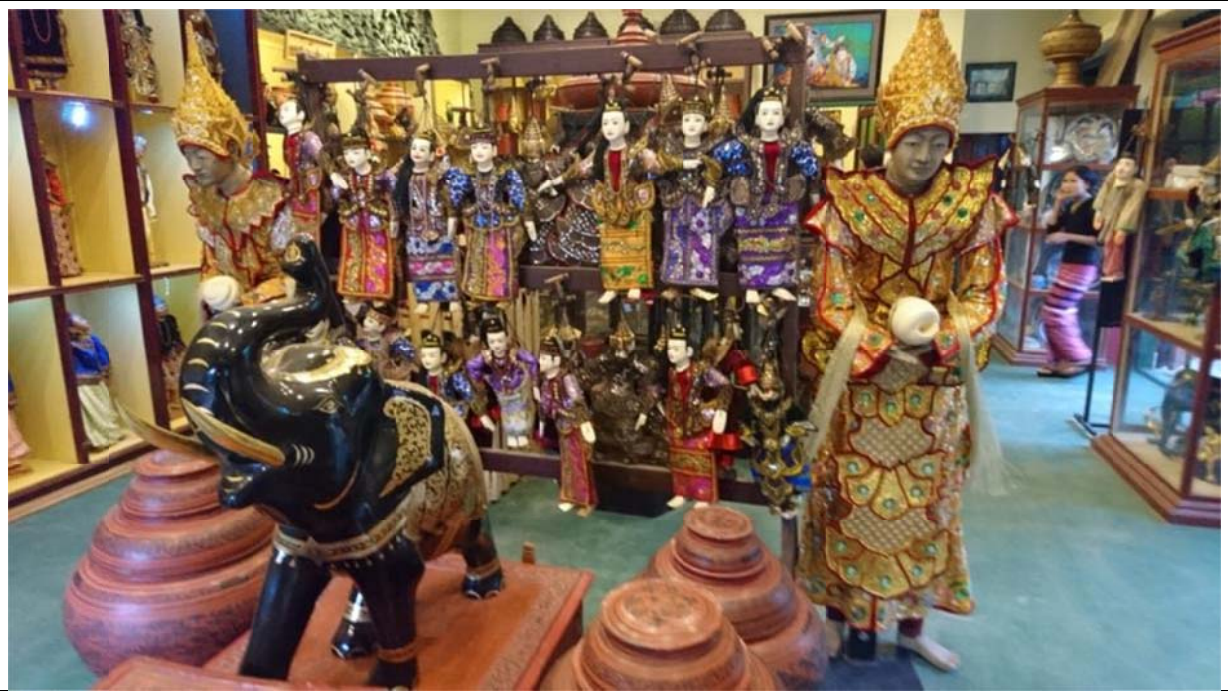
餐廳兼售懸絲傀儡戲偶與漆器