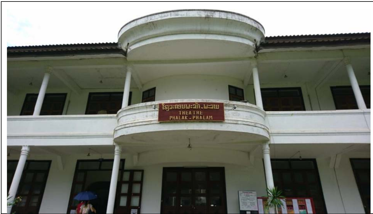
Phralak Phralam 劇院外觀