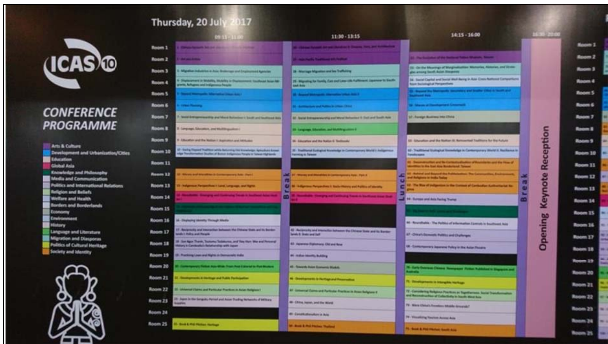
ICAS 大會專題演講、論壇共計分成 17 大類別（以色塊區分）