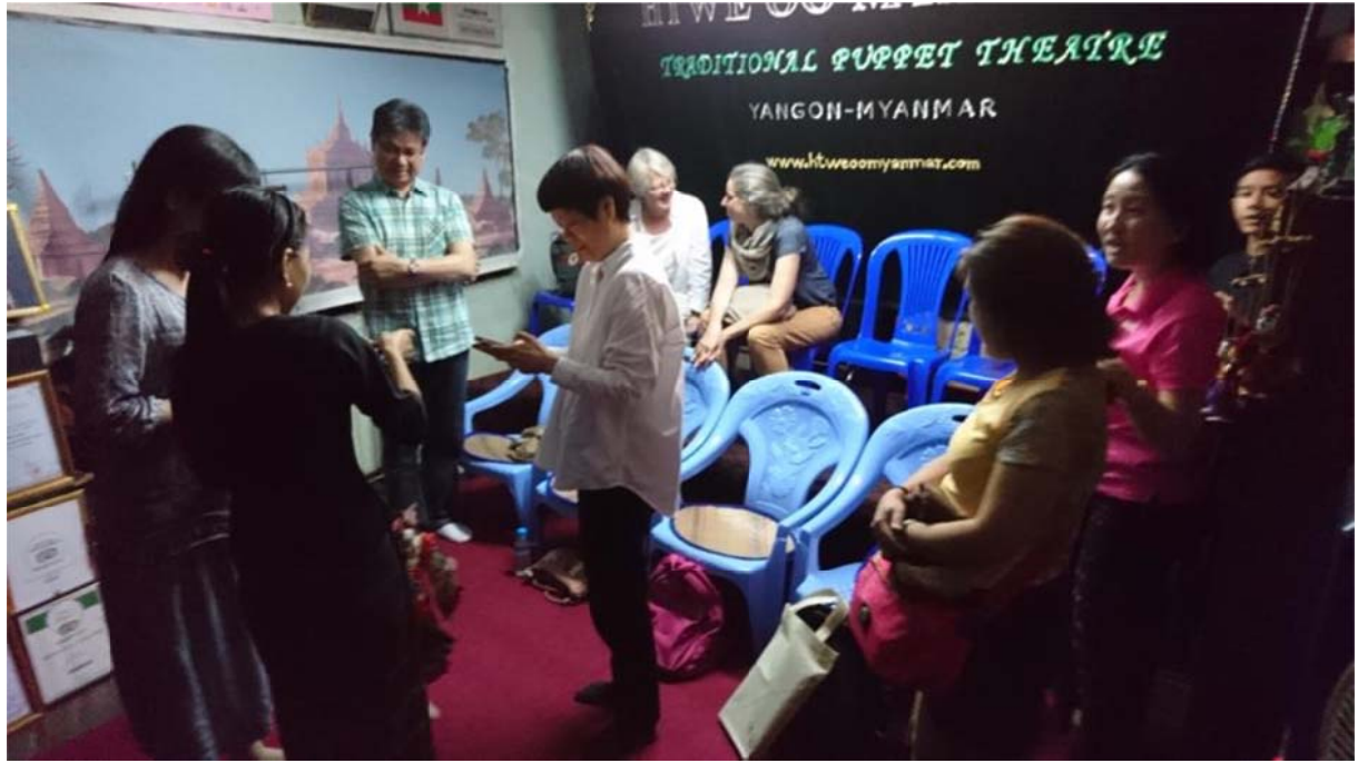
演出場地十分狹小僅能容納 10 人以內的觀眾