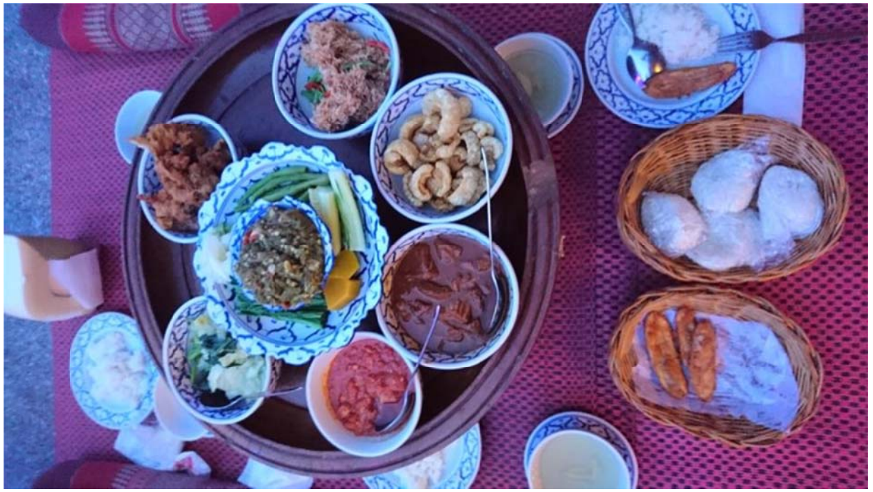
餐廳無限供應蘭納皇室傳統形式餐點