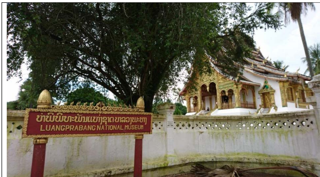
龍坡邦國立博物館

皇宮博物館旁有一座原為接待廳的建築，目前改運用為 Phralak Phralam 劇院，由皇家芭蕾舞團 (Royal Ballet Theatre) 負責營運及演出羅摩衍那史詩舞蹈。該團自 2003 年開始運作。每週一、週三、週五、週六演出，票價分為 10 萬、12 萬、15 萬寮幣 (約新台幣 360-540 元之間)。該團每晚演出數支舞碼，長度約 2 小時，部分舞碼固定為迎賓舞、巨人舞、猴子舞等，但其中一支為羅摩衍那選段。舞團將羅摩衍那史詩拆為九個段落，每晚擇其中乙段演出。目前劇院有一百多位舞者，並由 Pinphat 形式樂團作為伴奏。