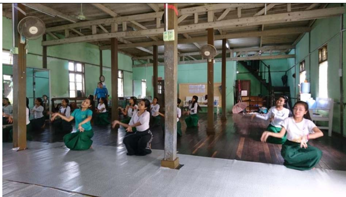
參訪女學生修習舞蹈課程