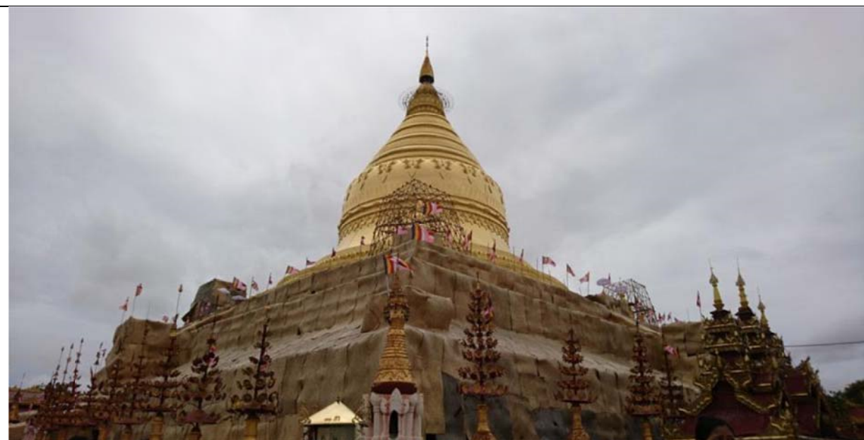
瑞海宮佛塔 (Shwezigon Pagoda) 參訪主塔進行整修中

蒲甘擁有 4000 多座古佛塔，與柬埔寨吳哥窟以及印尼婆羅浮屠並列為亞洲三大佛教遺跡。蒲甘最著名的瑞海宮佛塔 (Shwezigon Pagoda) 於西元 1113 年完成，主塔正在整修中，塔邊守護的寺廟建築上之人像雕刻，反映蒲甘時期的人物生活，十分精緻。當日還參訪建於 13 世紀的瑞雷杜佛塔 (Shwe Lake Too)、興建於 1218 年的提羅敏羅佛塔 (Htilominlo Temple) 等。