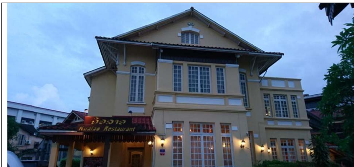
Kualao Restaurant 外觀

Kualao Restaurant 自 1994 年開始營業，其改造一座法式殖民別墅，提供寮國道地風味餐點，晚間並安排傳統樂舞演出，全年無休，精緻結合美食與文化觀光。以參訪當日觀察，演出者來自藝術學校之專業人士，共計四位樂師，分別演奏木琴、胡琴、揚琴、鼓組，樂師兼唱寮國傳統歌謠或改編自其他國家的歌曲；其中演奏木琴的樂師另於壓軸時吹奏寮笙，展現精湛技藝。此外，搭配三位舞者，穿插表演三支傳統舞蹈，演出長度約自晚間 7-9 時。