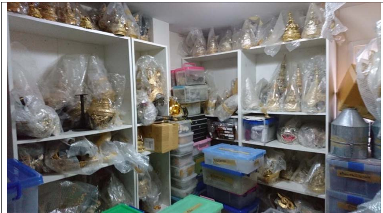
參觀團隊倉儲空間