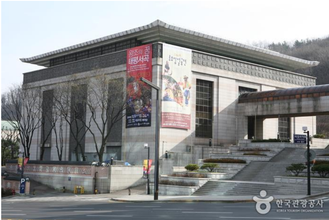
國立國樂院是韓國政府為了傳承和弘揚韓國傳統音樂與舞蹈藝術而設立的代表性音樂機構。