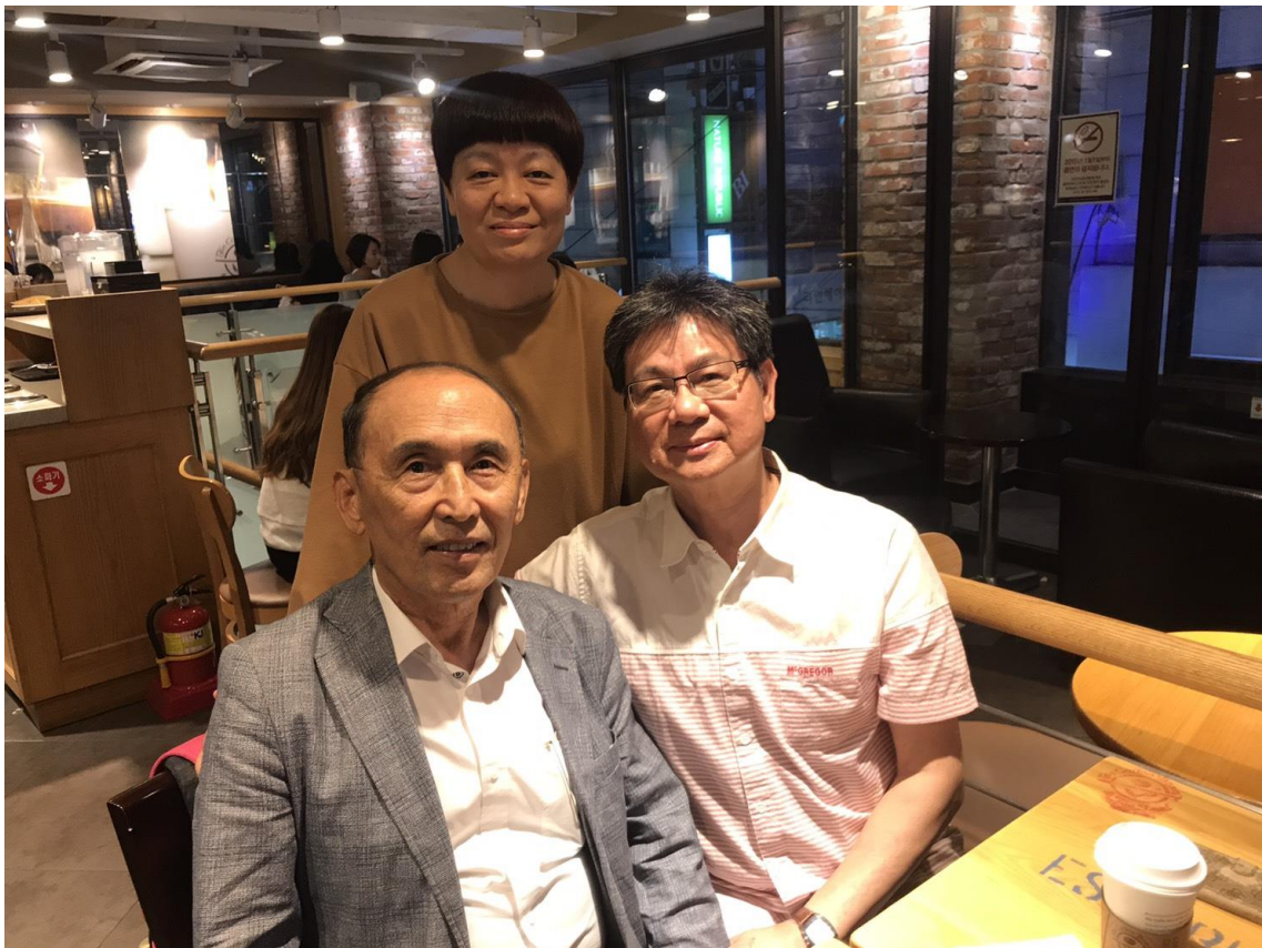
金泳宰教授(前左)是韓國重要非物質文化遺產第 16 號玄琴散調藝能持有者。