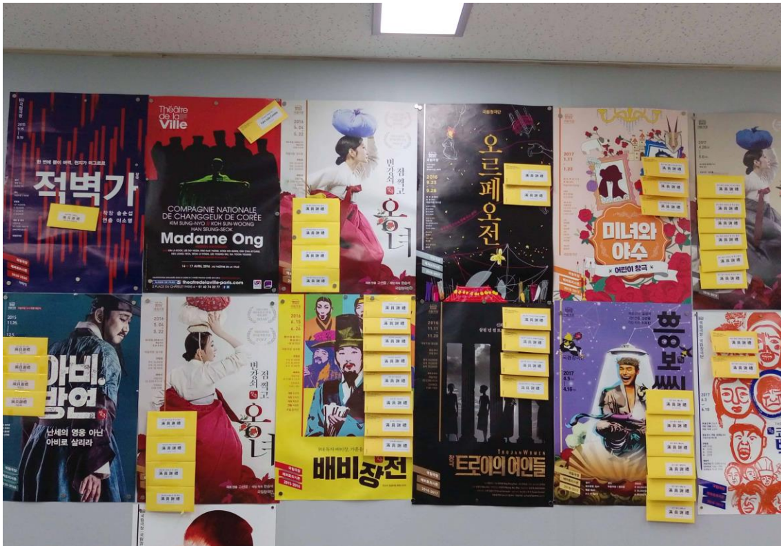
國立劇場的演出海報，其中多檔公演都貼上滿座的黃色標誌。