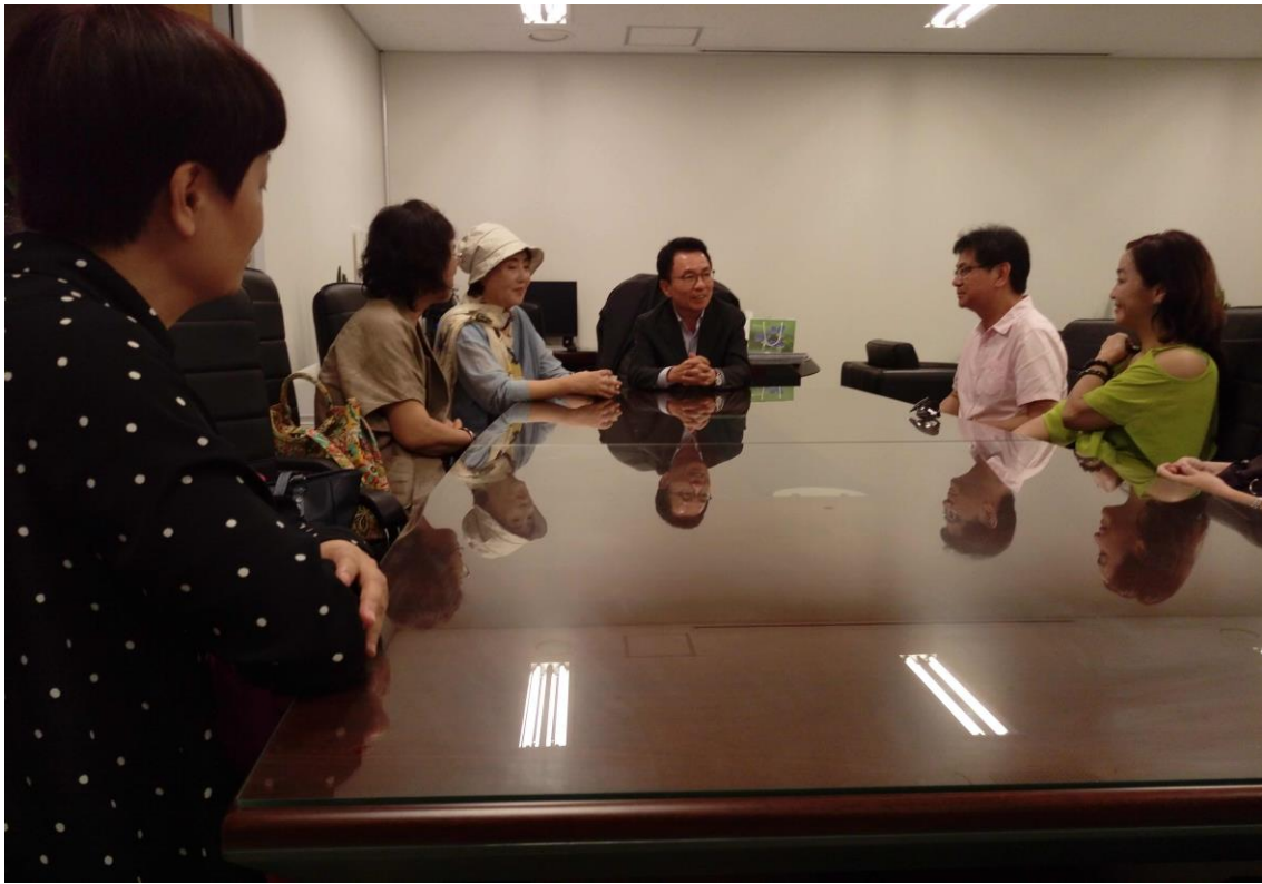
此行與國立劇場的安浩相執行長(右 3)及國立唱劇團金星女藝術總監(右 4)會談。