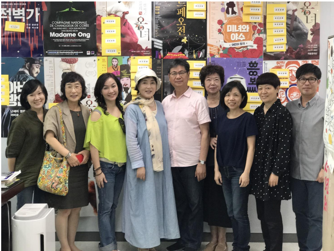
在國立唱劇團藝術總監辦公室合影。