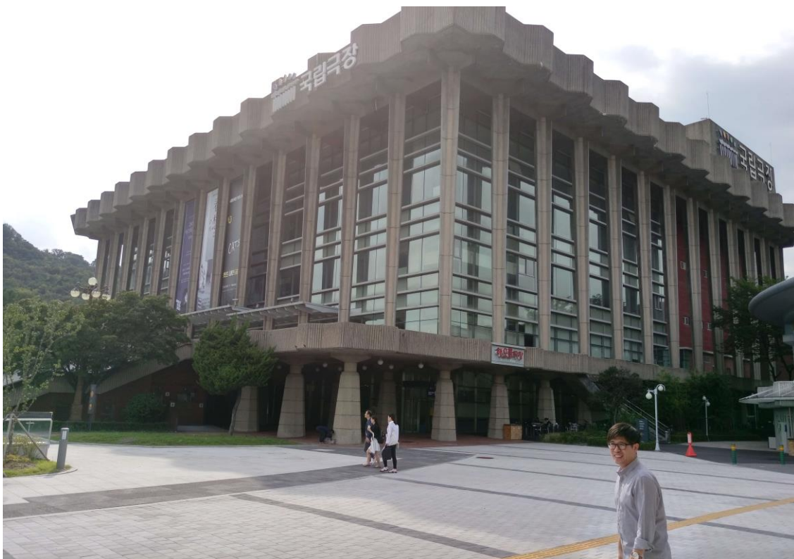
國立劇場是亞洲最早的國立劇場，是韓國繼承傳統藝術與宣導現代藝術的中心。