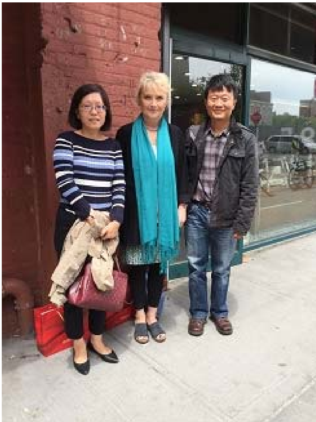
照片 2 世界音樂協會行政總監合照