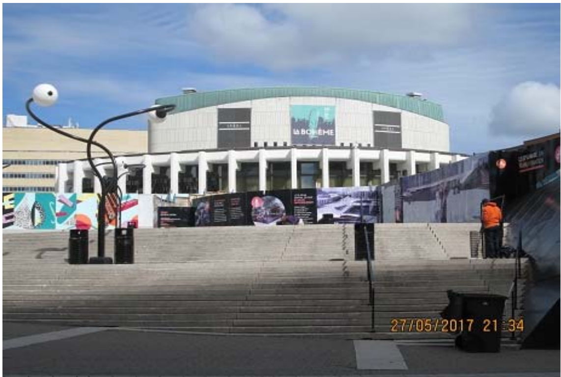
照片 8 蒙特婁藝術中心