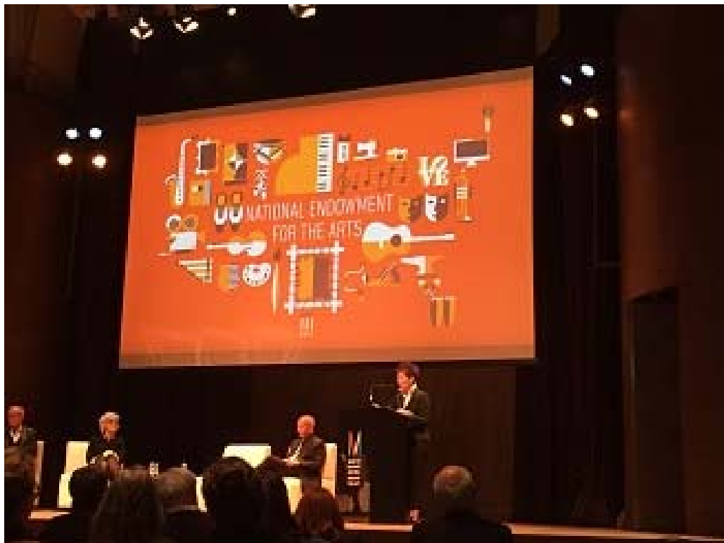
照片 18 美國NEC 主席及其他與談者