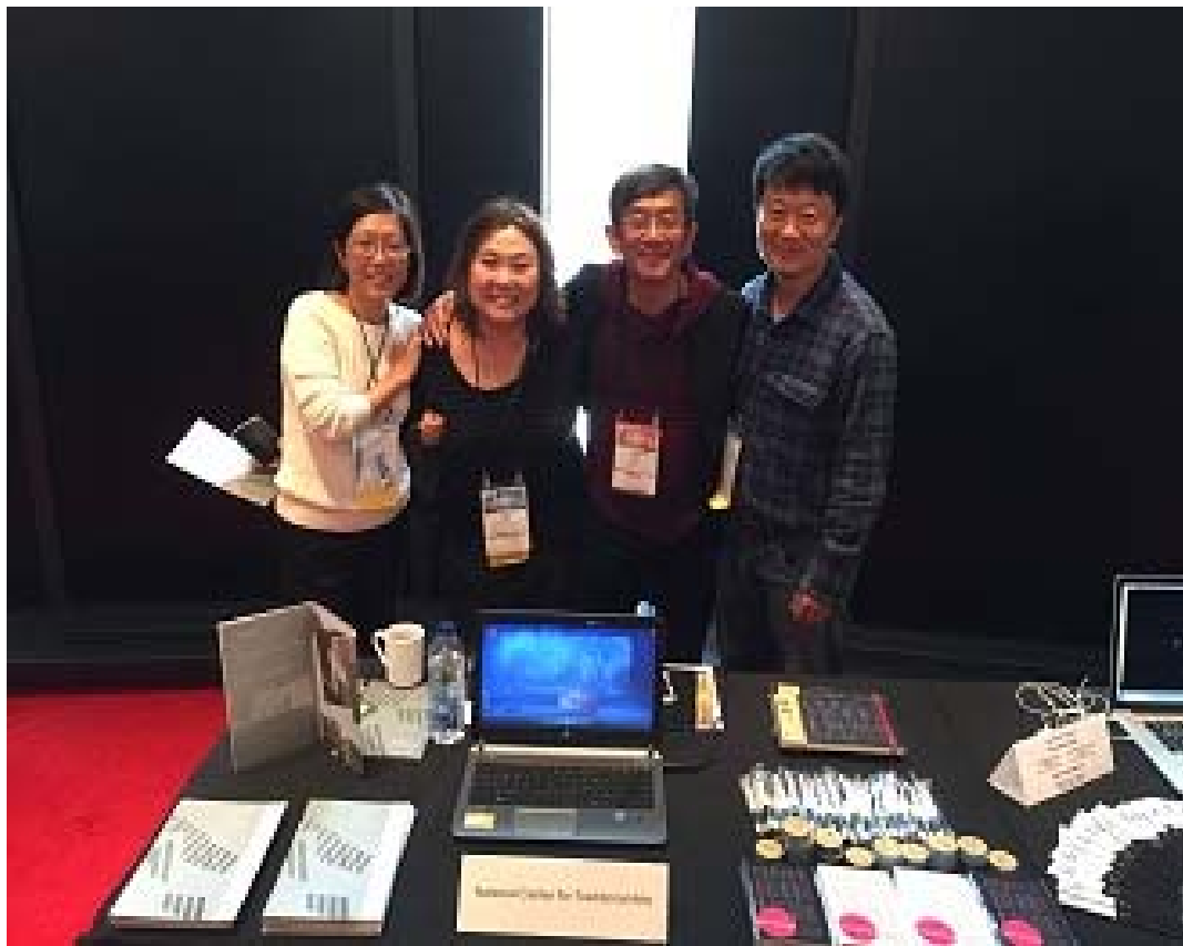
照片 12 ISPA 與韓國與澳門代表合照