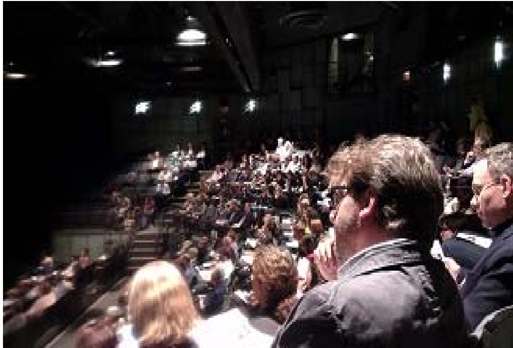
照片 9 ISPA 國際會議現場