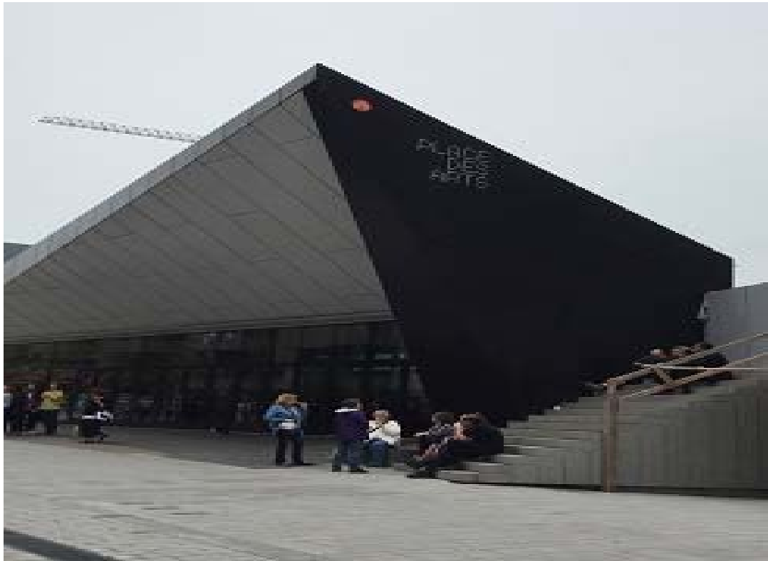
照片 5 蒙特婁藝術中心