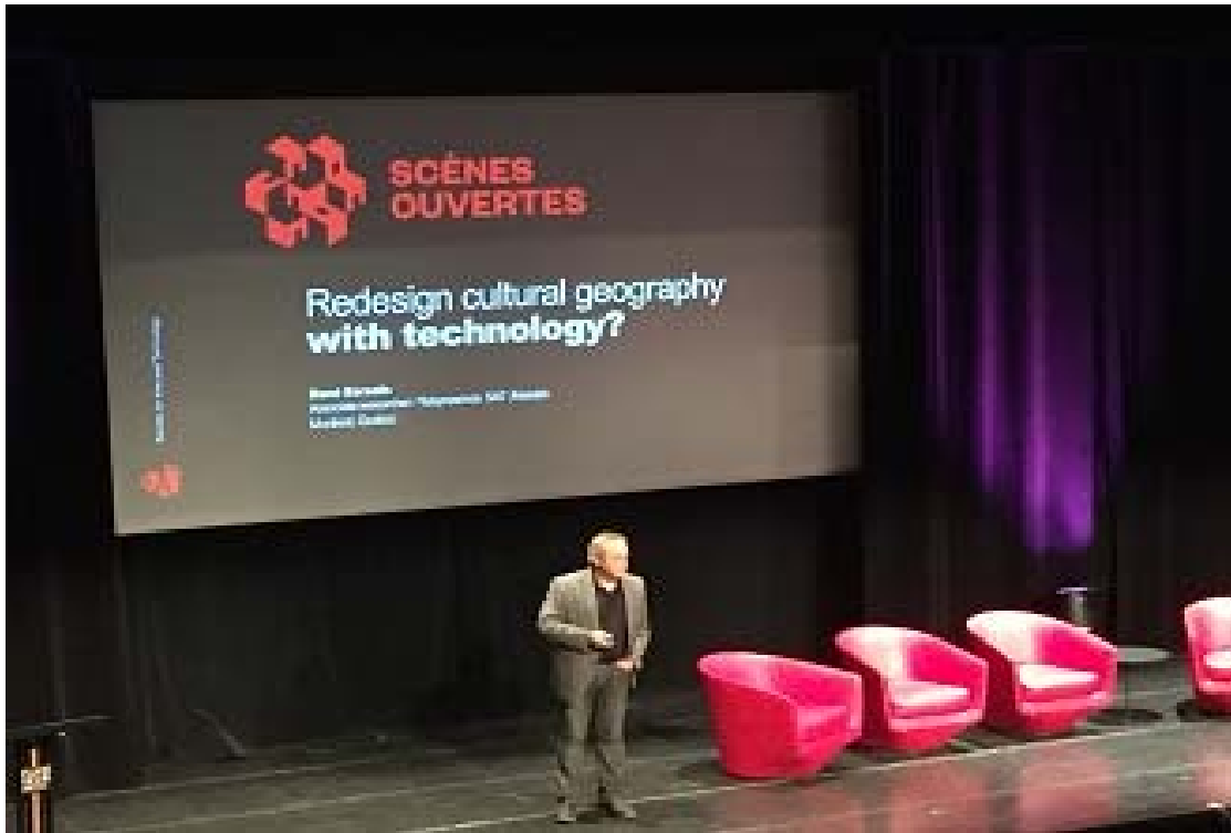
照片 13 ISPA 論壇現場