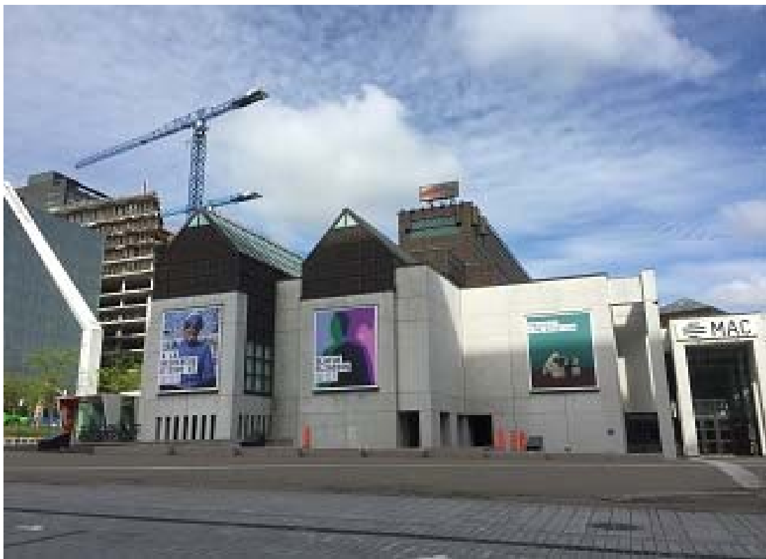
照片 6 蒙特婁藝術中心