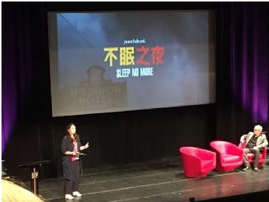
照片 14 ISPA 論壇現場