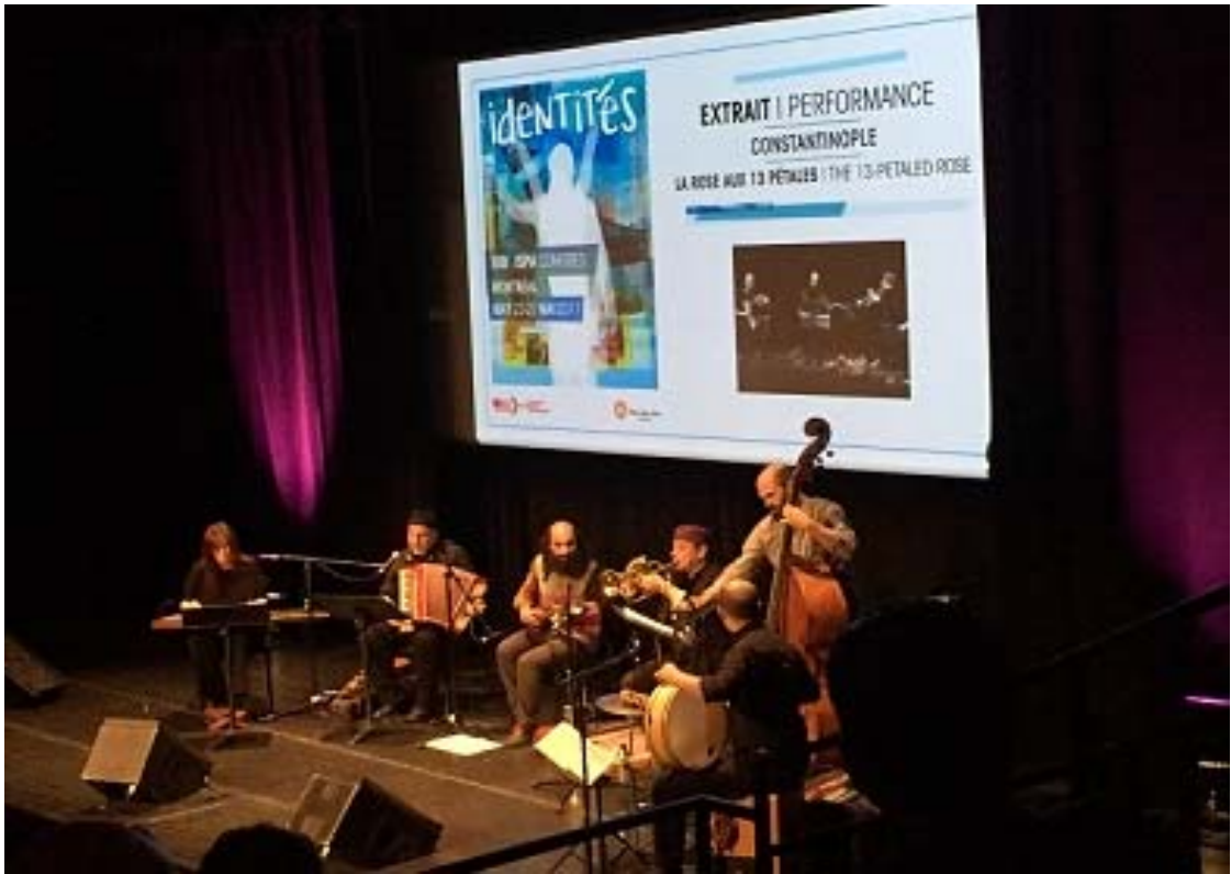
照片 15 ISPA 論壇休息表演