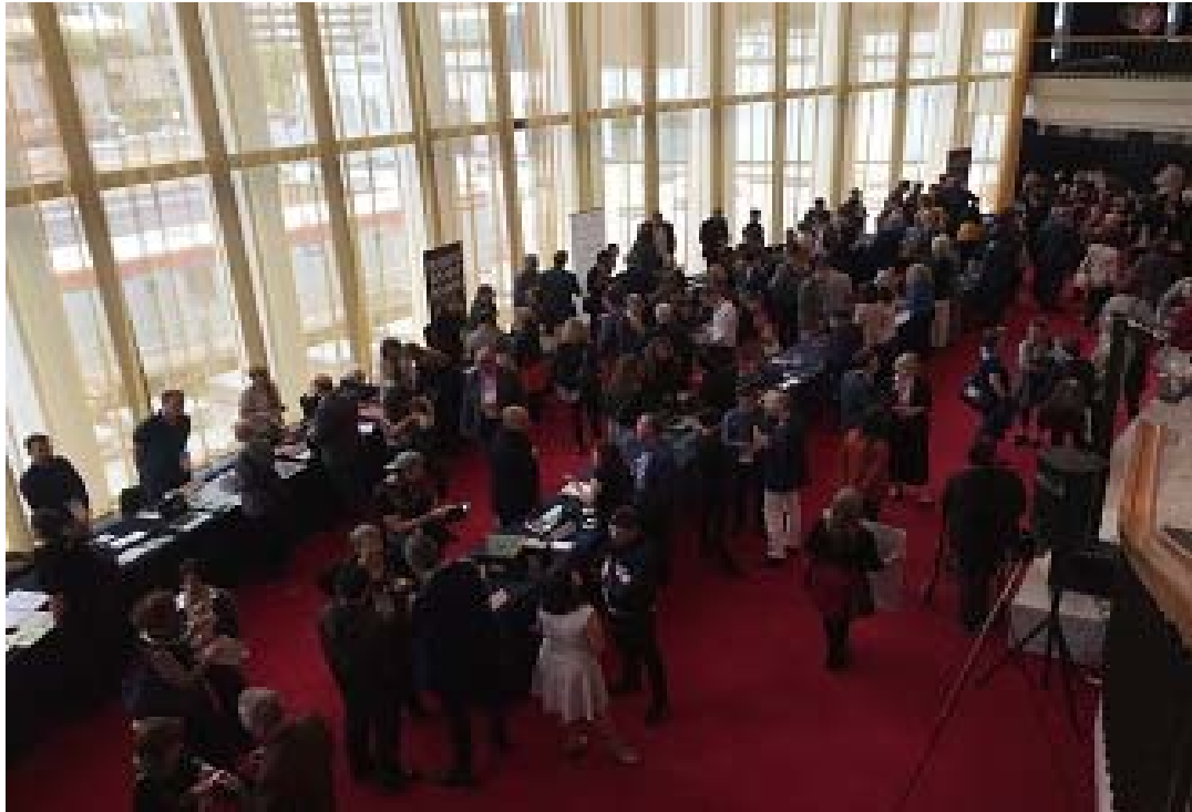
照片 11 ISPA 國際會議團隊攤位