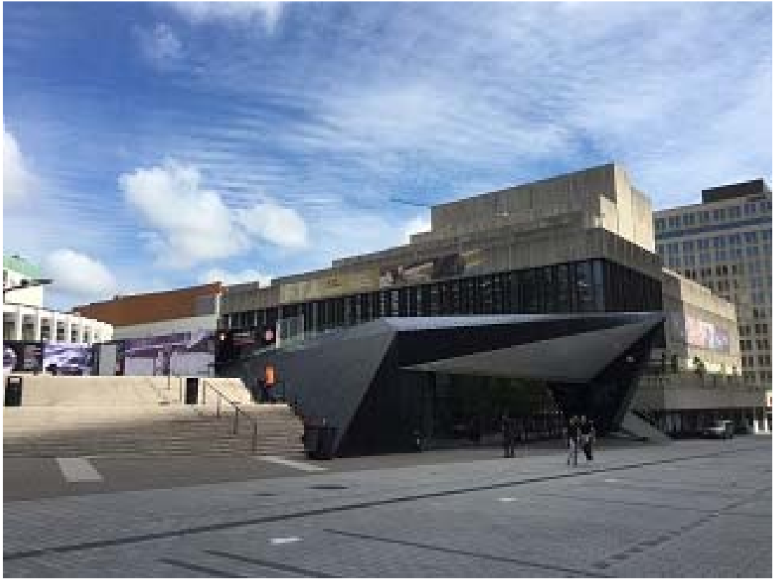
照片 7 蒙特婁藝術中心