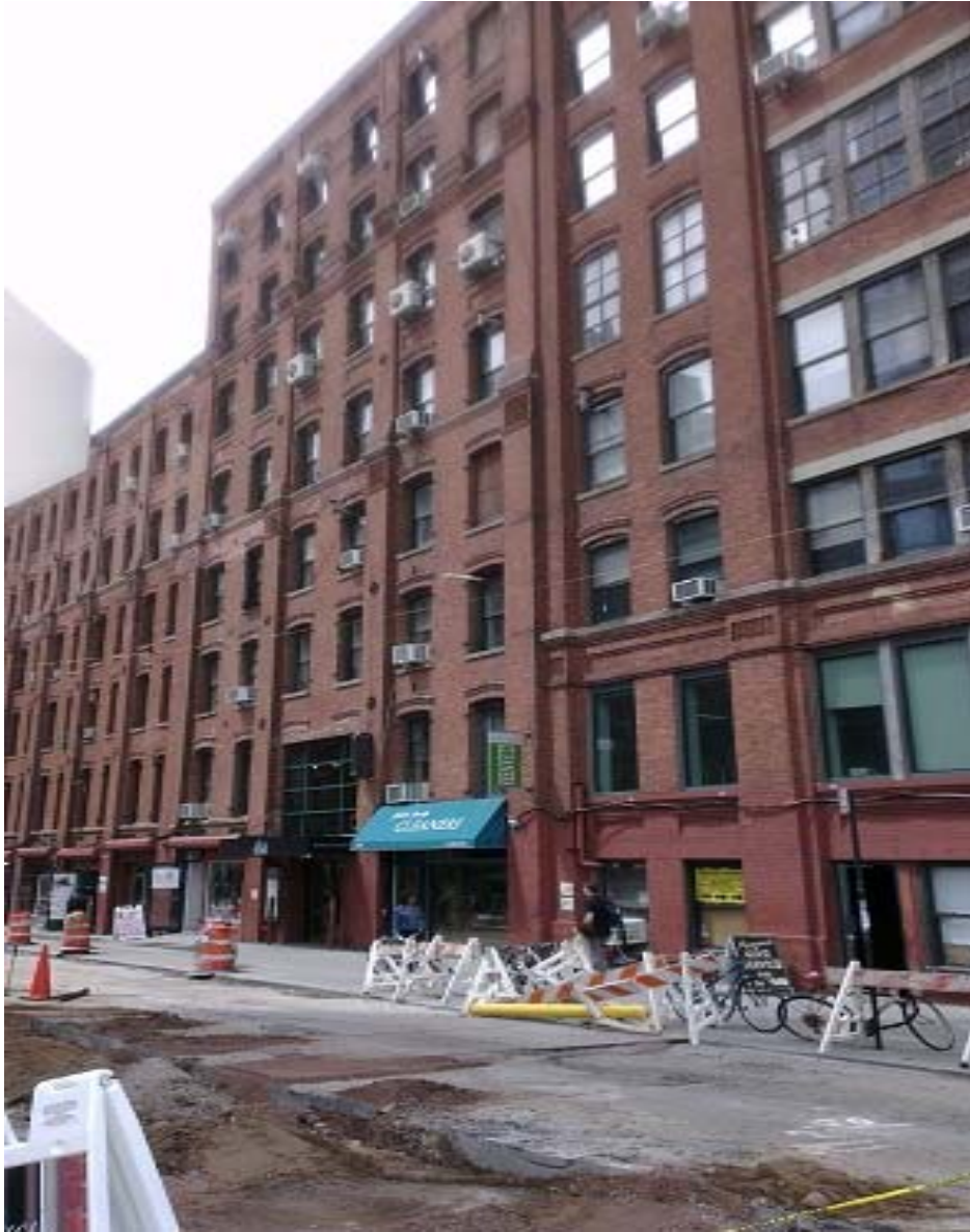
照片 1 世界音樂協會辦公室 由舊廠房改建的綜合辦公室中小小的一間