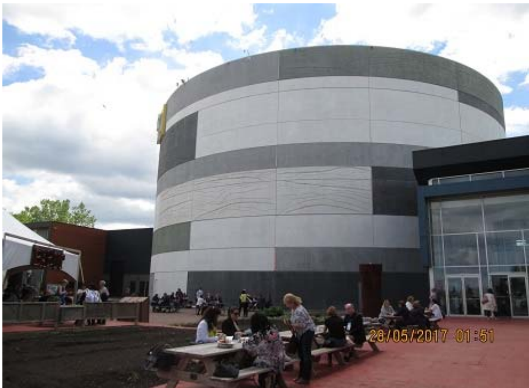
照片 16 TOHU 場館