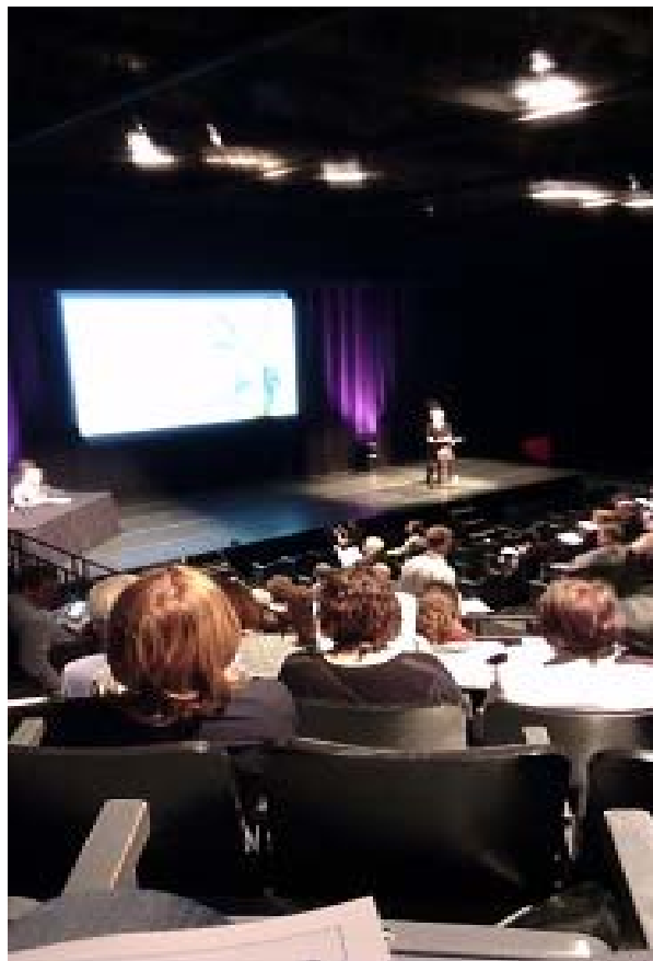
照片 10 ISPA 國際會議現場