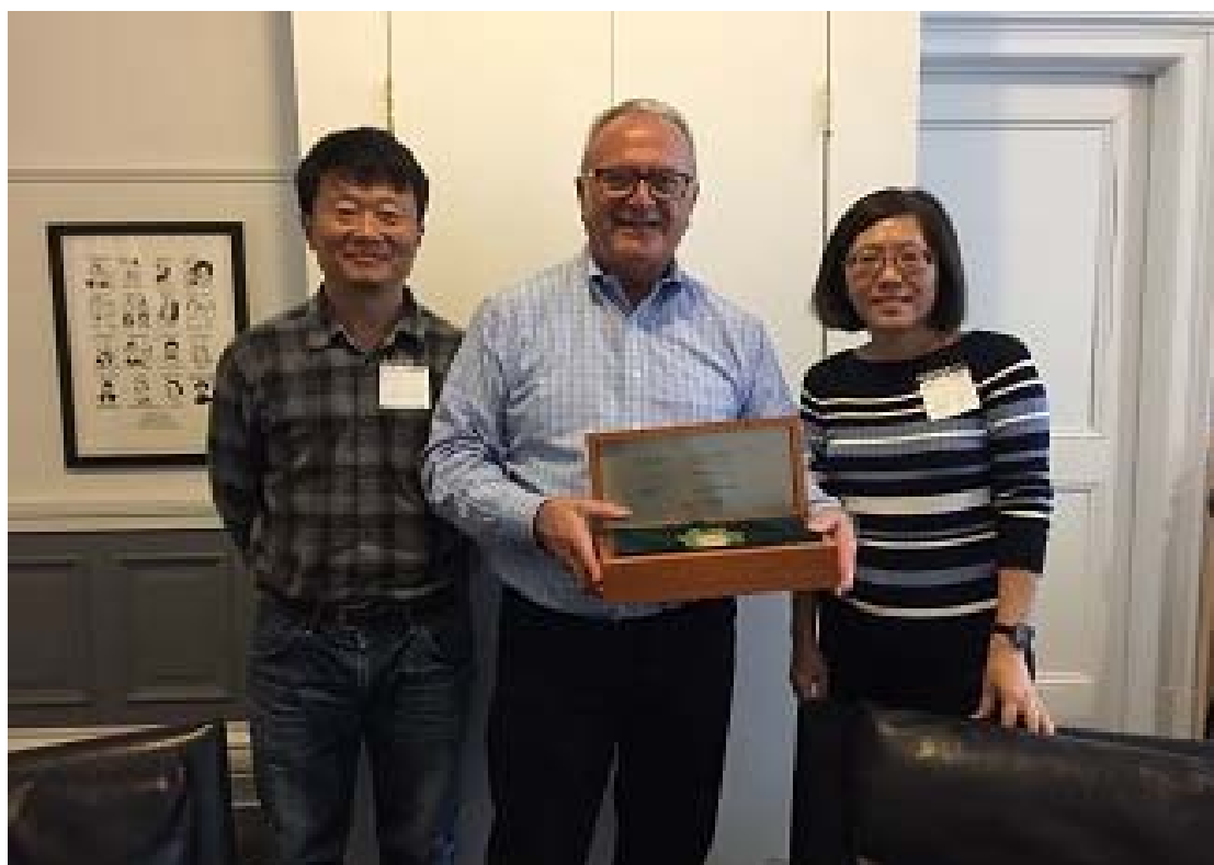
照片 4 布魯克林音樂學院執行製作人合照