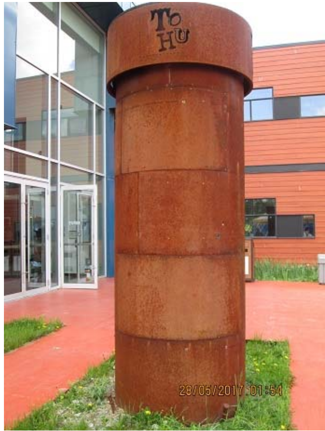
照片 17 TOHU 場館