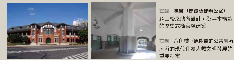
左圖 | 廳舍 (原鐵道部辦公室) 森山松之助所設計，為半木構造的歷史式樣官廳建築

「北門館」前身是清代臺北機器局與日本時代鐵道部，從兵器修理、火車維修廠到鐵路行政管理中樞，是臺灣第一個科學工業園區，也是第一代火車醫院。園區現存6棟國定古蹟及2棟市定古蹟，你知道這些古蹟建築和現代社會有什麼連結嗎？