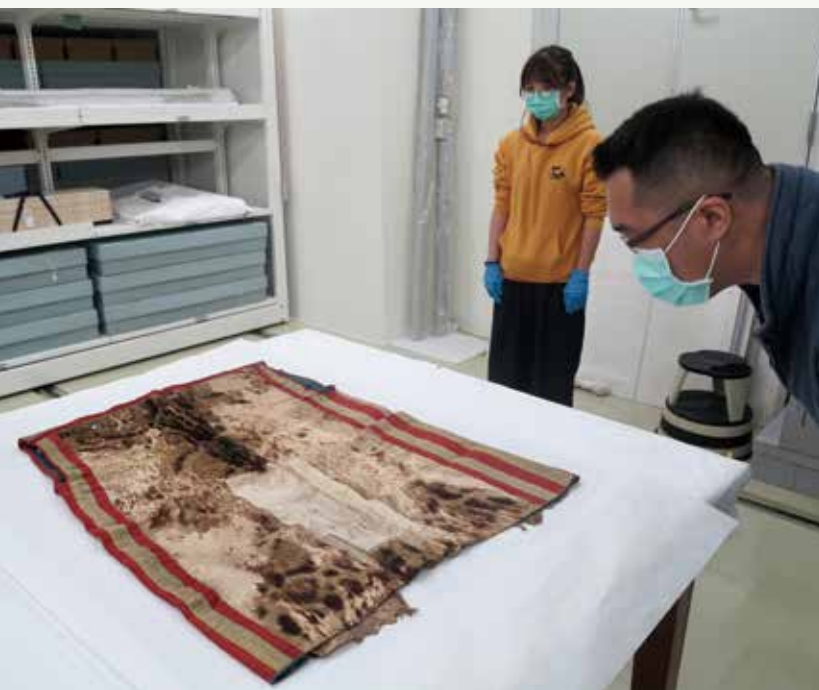
左 | 漫畫家於臺博館庫房觀看與漫畫內容設定有關之本館重要館藏 中 | 漫畫家所捐贈的手稿，成為臺博館首批「漫畫」收藏

臺博館團隊除了提供專業上的諮詢審查與各方的溝通協調，在漫畫創作籌備期間，本館邀請漫畫家和出版社編輯參訪本館庫房，讓漫畫家瀏覽博物館庫房空間及各學門的收藏，本館團隊也預先挑選了有關這次漫畫素材所需參考之藏品，像是珍貴的雲豹衣、原住民服飾（魯凱、排灣族）和雲豹標本供漫畫家拍照、記錄，相關學門的研究人員亦陪同負責介紹與回覆問題。漫畫家本身也做足功課，參考、閱讀與故事（分鏡腳本）、角色設定相關的文獻資料、老照片及書籍，甚至還將家裡的貓作為漫畫雲豹角色肢體動作的「模特兒」，使得雲豹角色在畫格中顯著活靈活現、生動自然。