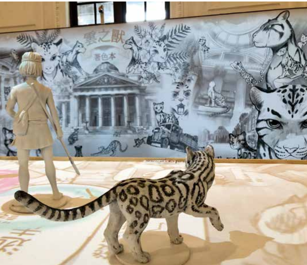
左 | 「漫筆臺博」微型展展出漫畫家手稿，讓觀眾得以近距離欣賞手繪筆觸細膩之處 中 | 展覽結合科技互動，並將漫畫角色立體化，創造漫畫圖像 IP 衍生應用的可能性 右 | 「雲之獸來了」 Line 動態貼圖