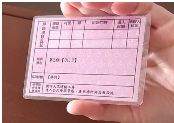
身心障礙證明背面，障礙類別註記 第 2 類【01.3】表示是重度視覺障礙者

視障者持有的身心障礙證明背面，「障礙類別」的欄位會標註「第 2 類【01.N】」的字樣(N=1, 2, 3，分別表示輕度、中度或重度)。所以，全盲視障者的身心障礙證明上，背面的標註就是「第 2 類【01.3】」。