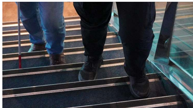
視障者握住引導者的手肘 引導者要走在前方