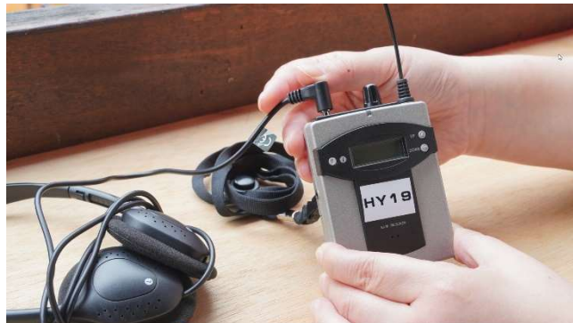
戲院口述影像服務使用之接收器及耳機

口述影像無線電發射器可以接 3.5mm 接頭的耳機。影城除了提供基本配備的耳機外，亦可考慮開放觀眾自備耳機使用。但需注意無線發射系統並不能配接藍芽耳機。